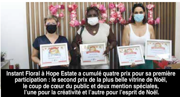
Instant Floral à Hope Estate a cumulé quatre prix pour sa première participation : le second prix de la plus belle vitrine de Noël, le coup de cœur du public et deux mentions spéciales, l'une pour la créativité et l'autre pour l'esprit de Noël.

Organisé par la Chambre Consulaire Interprofessionnelle de Saint-Martin (CCISM), le « Concours des vitrines de Noël 2021 » a été remporté par le salon de coiffure Lilou à Marigot, devant la boutique Instant Floral à Hope Estate et MerSea à Marigot.