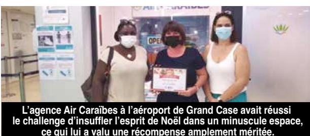
L'agence Air Caraïbes à l'aéroport de Grand Case avait réussi le challenge d'insuffler l'esprit de Noël dans un minuscule espace, ce qui lui a valu une récompense amplement méritée.