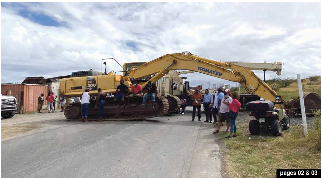
pages 02 & 03

Jules Charville, candidat à l'élection territoriale