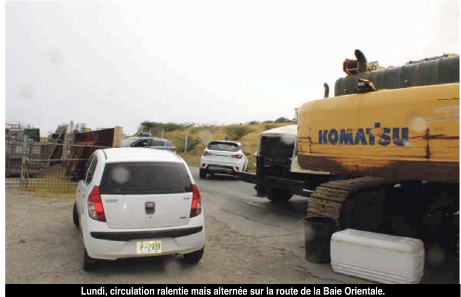
Lundi, circulation ralentie mais alternée sur la route de la Baie Orientale.