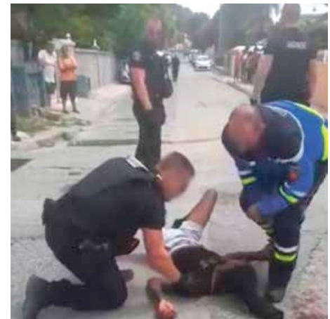
Capture d'écran d'une vidéo transmise par la gendarmerie

Une vidéo et de fausses informations diffusées sur les réseaux sociaux, prétendant que le jeune avait été accidenté lors d'une course-poursuite avec les gendarmes, qu'il était dans le coma et qu'à terre il aurait été molesté et menotté par les gendarmes, ont enflammé la colère d'une cinquantaine de jeunes, qui dès la soirée, vers 21h30, ont mis le feu aux poubelles dans le quartier de Sandy Ground. Une patrouille de gendarmerie est envoyée sur les lieux qui confirme les incendies et le militaire officier de permanence décide d'aller à la rencontre des jeunes pour entamer un dialogue. Mais des pavés lui sont jetés dessus, le blessant légèrement et endommageant la voiture de patrouille. Une autre patrouille a été appelée en renfort qui s'est positionnée au niveau du rond-point du cimetière, afin de bloquer la circulation. Cette dernière faisant aussi l'objet de jets de pierres, les militaires