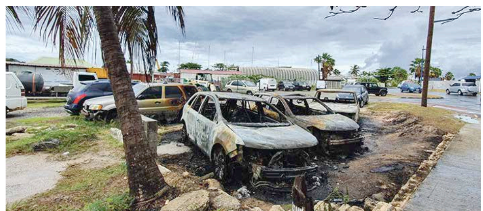
Des véhicules stationnés sur le parking en face de la résidence Pirate, ont été incendiés.