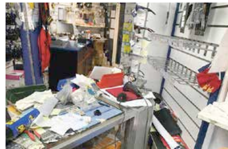
Trois commerces ont été pillés, ici Island Water World situé à côté du rond-point du cimetière.

A la veille des festivités du 14 juillet, les forces de l'ordre appellent au calme, au dialogue et insistent sur les opérations de sécurité routière qui sont nécessaires et importantes pour mettre un frein aux trop nombreux accidents de la route qui tuent et blessent de nombreux jeunes sur les routes. V.D.