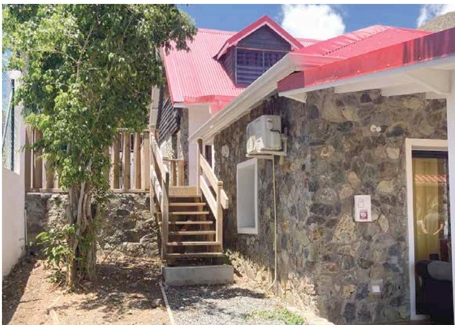
Résidence Césaria à Quartier d'Orléans