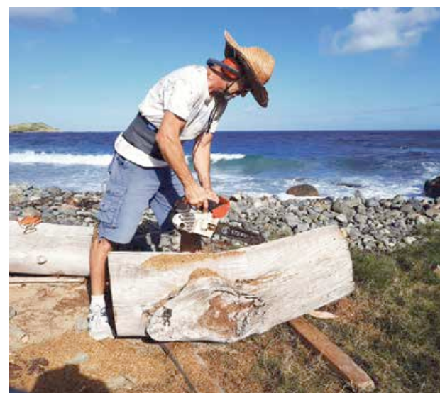
L'artiste en plein travail dans son décor naturel