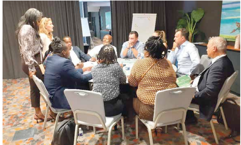
Plusieurs ateliers étaient organisés avec les différents partenaires de la formation, par thématiques, pour esquisser les premières pistes de travail.

De son côté la Collectivité a d'ores et déjà entrepris de restructurer ses services pour : renforcer la communication auprès de ceux qui sont éloignés de l'emploi, lancer une étude pour inventorier les besoins en formation sanitaire et sociale, avec un focus sur le logement, engager un