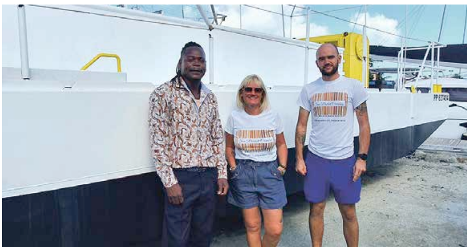
Photo d'archive : les opérateurs de Sea Protect Caraïbes à l'arrivée de la barge à Saint-Martin

Le directeur de l'environnement rappelait par ailleurs que la Collectivité et l'Etat, à l'occasion de l'installation du comité de pilotage en septembre dernier, avait annoncé à titre expérimental et pour une première réponse immédiate au fléau, la pose de filets de barrage en amont des baies de Cul de Sac et de l'Embouchure. A Cul de Sac, l'objectif étant de sanctuariser la baie, notamment au niveau de l'embarcadere afin de protéger l'activité de Pinel et des passeurs. Concernant la Baie de l'Embouchure, il s'agit là de protéger la mangrove de l'Etang aux Poissons. Les filets de barrages qui devraient être installés d'ici fin avril redirigeront les algues brunes vers des points de collecte à terre, qui impactent le moins possible les résidents. « Nous en sommes à cette première étape et nous lançons parallèlement une étude de faisabilité pour déterminer s'il est opportun de prévoir à la suite un ramassage en amont des sargasses en mer ». Arrivée sans doute trop tôt, et peut-être sans avoir mené en amont une réflexion avec les services concernés de la Collectivité et de l'Etat, la barge qui semblait pourtant être apportée sur un plateau pour participer à endiguer le fléau des algues brunes sur le territoire, pourrait bien partir voguer et travailler vers d'autres eaux... V.D.