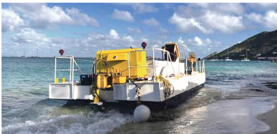
La barge destinée à ramasser les sargasses en mer a décroché de son mouillage et a échoué sur la plage de Grand Case

La barge de ramassage des sargasses en mer construite à l'initiative de la société Sea Protect Caraïbes a été retrouvée échouée en ce début de semaine sur le rivage de Grand Case. Découragés par ce désagrément involontaire ou pas, et déconcertés par le peu d'engouement rencontré de la part des autorités locales pour leur solution de ramassage des sargasses en mer, les opérateurs envisagent de proposer leurs services à un autre territoire également impacté par le fléau des échouements.