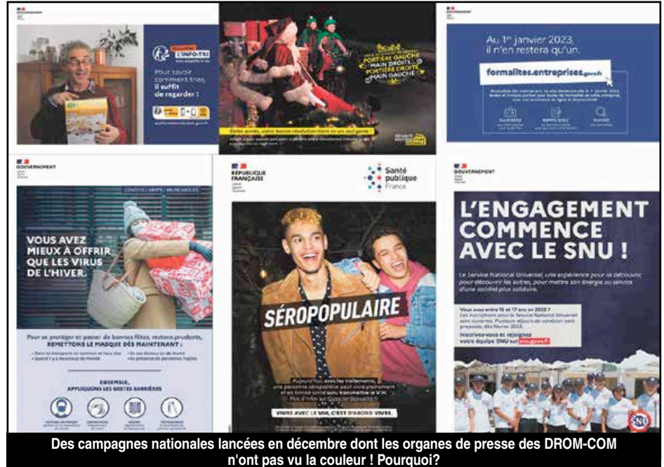
Des campagnes nationales lancées en décembre dont les organes de presse des DROM-COM n'ont pas vu la couleur ! Pourquoi ?

Preuve en est s'agissant des campagnes de communication nationales lancées par l'Etat central, ses ministères et autres organismes satellites. Pour le seul mois de décembre, pas moins d'une dizaine de campagnes ont été menées, traitant