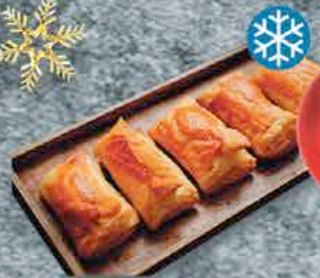
FEUILLETÉS ST JACQUES 4X65GR