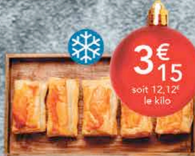
FEUILLETÉS SAUMON CREVETTES 4X65GR