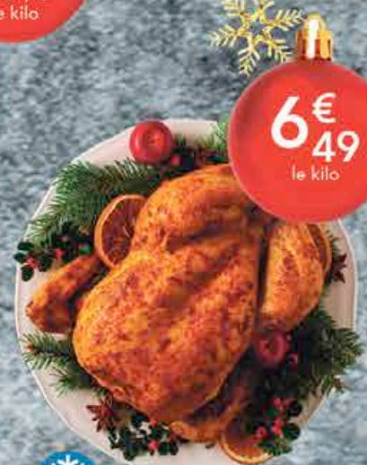
DINDE POIDS VARIABLE

L'abus d'alcool est dangereux pour la santé, consommez avec modération. Suggestion de présentation. Photos non contractuelles. Dans la limite des stocks disponibles POUR VOTRE SANTÉ, PRATIQUEZ UNE ACTIVITÉ PHYSIQUE RÉGULIÈRE. WWW.MANGERBOUGER.FR