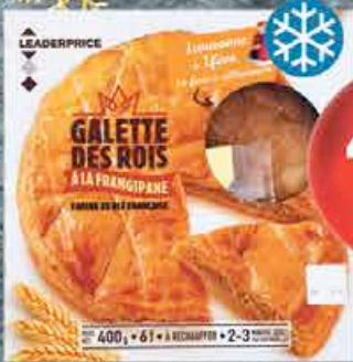
GALETTE DES ROIS À LA FRANGIPANE 400GR