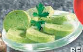
BEURRE AIL PERSILLÉ 250GR