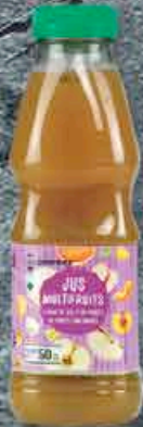
JUS MULTIVITAMINÉ 50CL