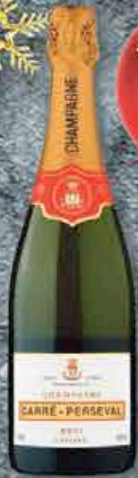
CHAMPAGNE CARRÉ PERSEVAL 75CL