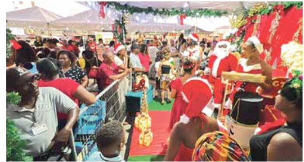
Distribution de cadeaux à l'occasion du Noël des enfants organisé à Marigot par la Collectivité de Saint-Martin.

Les enfants, dans tous les quartiers, ont été les rois de la fête car les distributions de cadeaux ont ponctué chaque journée précédant Noël. Associations, clubs, particuliers ou professionnels, les généreux donateurs ont été nombreux. Parmi ces moments magiques pour les enfants, on retiendra la distribution de cadeaux