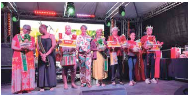
Les lauréates du Concours de tartes et puddings de Noël organisé au Christmas Village de Marigot