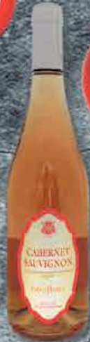
CABERNET SAUVIGNON MOELLEUX 75CL