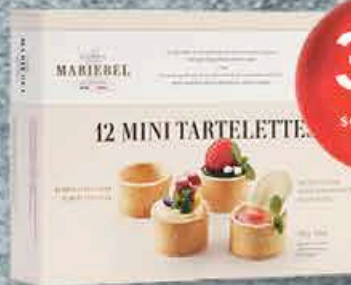
MINI TARTELETTES X12