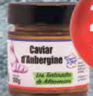
CAVIAR AUBERGINE 100GR