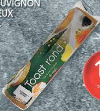
TOAST BRIOCHÉ OU SEIGLE 300GR