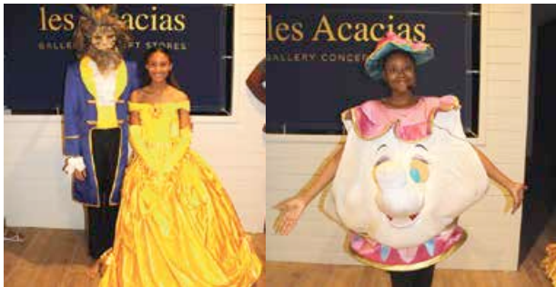
La Belle, la Bête et la thière ... un tableau, parmi les huit présentés, sur le thème de Disney lors du marché de Noël des Jeudis en Folie.

Les Jeudis en Folie de l'Anse Marcel ont fait un début très remarqué avec leurs deux premières éditions placées sous le thème de Noël. Jeudi dernier, c'était la magie de Disney qui régnait dans les lieux pour le plus grand plaisir des enfants (mais on a aussi entendu des mamans chanter à tue-tête les grands classiques des dessins animés) qui ont pu assister à un beau spectacle de comédies musicales reprenant les plus grands standards. Les Jeudis en Folie continuent mais désormais avec une thématique différente chaque jeudi (à partir de 18h).