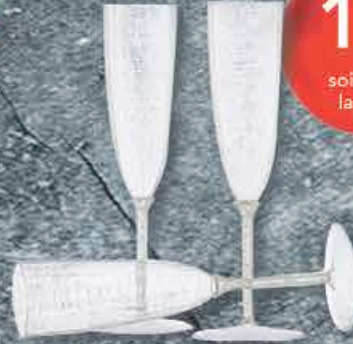
FLÛTES À CHAMPAGNE X6