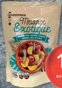
MÉLANGE EXOTIQUE 120GR