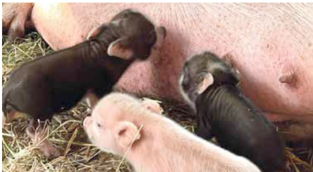
Les trois petits cochons, version Rockland Farm !

Parce que la vie à la ferme ne s'arrête jamais, il peut parfois se passer des événements heureux en cette période de Noël. Ce fût le cas à Rockland Farm qui a accueilli à la veille du réveillon sa première portée de petits cochons. Trois adorables petits porcelets dont on ne sait pas encore s'ils se prénommeront Nif-Nif, Nouf-Nouf et Naf-Naf comme dans le dessin animé de Disney. Mais c'est cela aussi la magie de Noël !