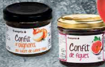
CONFIT FIGUES OU OIGNON 110GR