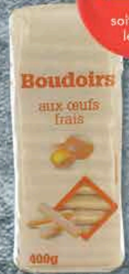
BOUDOIRS OEUFS FRAIS 400GR