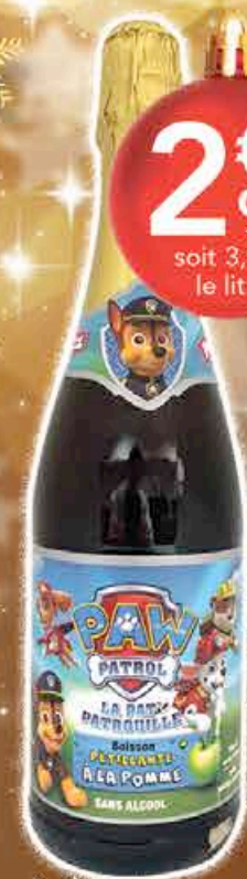
PARTYFIZZ PAT PATROUILLE OU LICORNE - 75CL