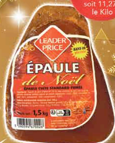
EPAULE FUMÉE CUITE S/OS NOËL 1,5KG