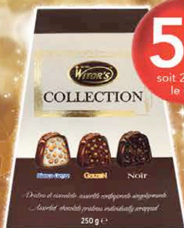
MINI BAG BONBONS DU CHOCO 250G