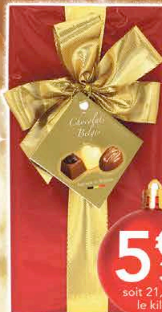
CADEAU + RUBAN CHOCO BELGES 250G