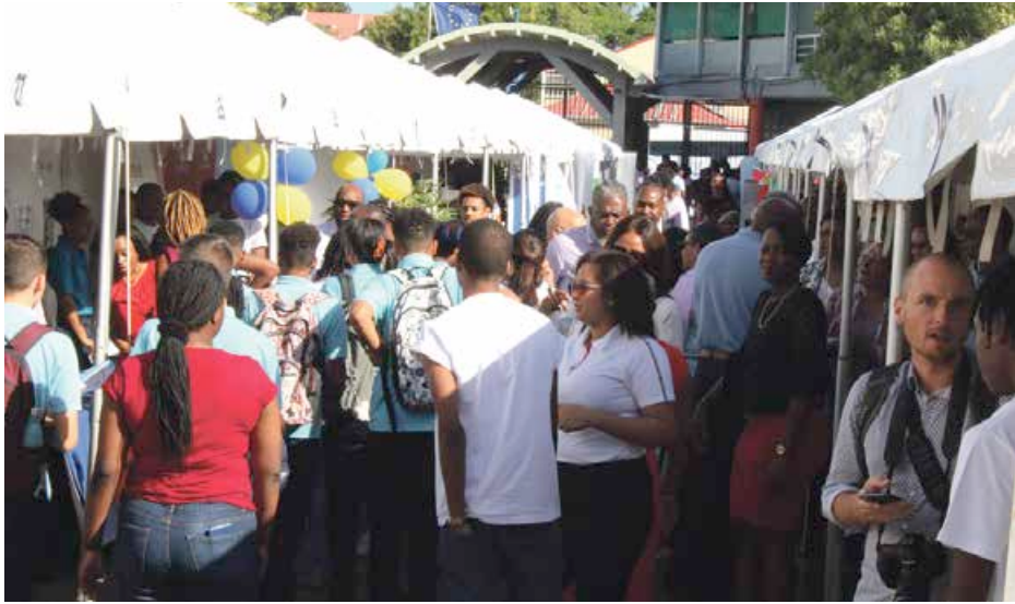
Belle affluence hier matin pour cette première journée du salon.

La première édition du Salon de l'orientation et de la mobilité de l'étudiant, s'est ouverte hier au lycée professionnel Daniella Jeffry. Une opportunité pour collégiens et lycéens de profiter de la présence de représentants d'universités, d'écoles, d'institutions, de conseillers en formation ... du territoire ou extérieurs venus à leur rencontre. Ce vendredi, de 8h à 20h, la trentaine d'exposants accueillera les élèves de première, de terminale et de BTS et la journée sera ponctuée d'ateliers et de conférences.