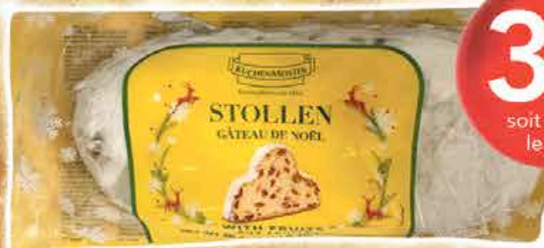
GATEAU STOLLEN 750G