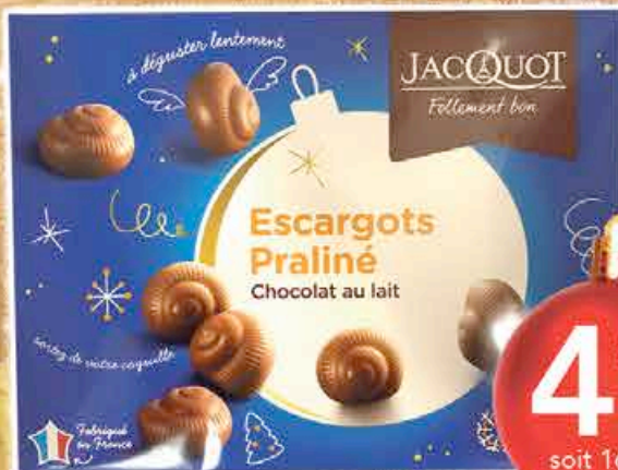
ESCARGOTS PRALINÉS LAIT 300G