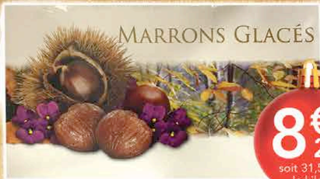
MARRONS GLACÉS ENTIERS 255G

PROMOTIONS VALABLES DU VENDREDI 9 AU DIMANCHE 25 DÉCEMBRE