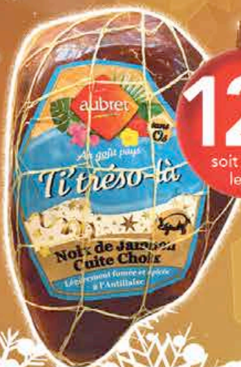
NOIX JAMBON NOËL TI-TRESO LA POIDS VARIABLES