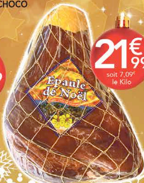
EPAULE FUMÉ AOS 3,1KG