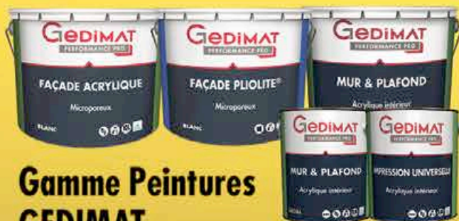
Gamme Peintures GEDIMAT

Intérieures et extérieures, pots de 2,5 et 10L