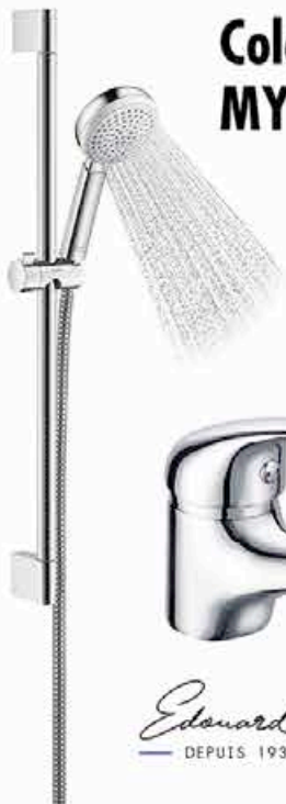
Colonne de douche MY CLUB VARIO