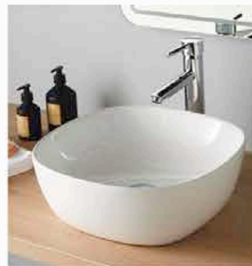
Vasque VILETTE à poser