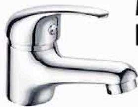
Mitigeur ATHENA lavabo