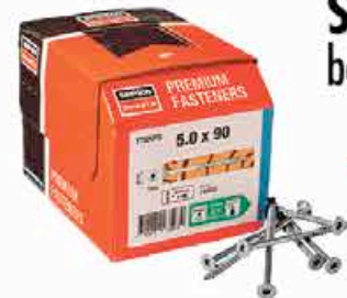
Vis Impreg®+ SIMPSON 6x100 boîte de 100