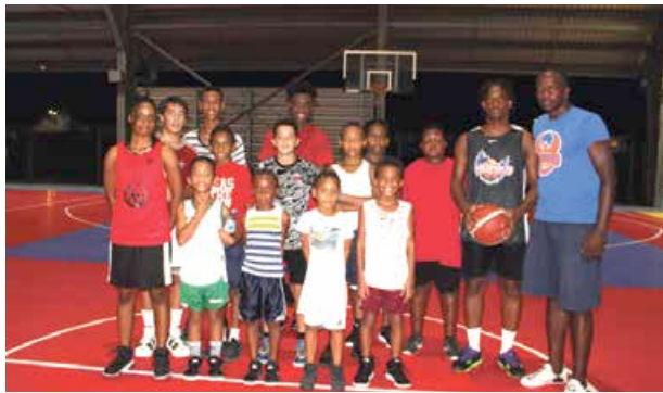
Entraînement de l'école de basket Phoenixicks (à partir de 5 ans) à la Halle des Sports.