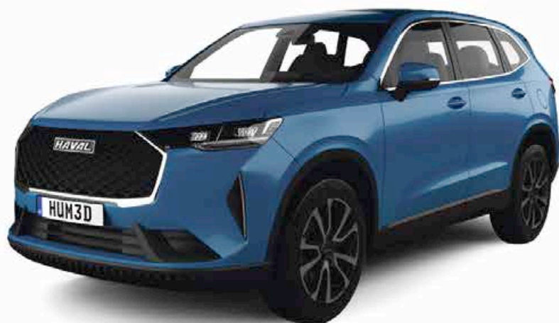
HAVAL H6 3 ème GÉNÉRATION

Portes Ouvertes le samedi 26 novembre de 9h00 à 17h00