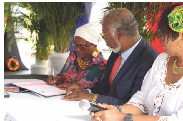
Signature du protocole d'accord d'utilisation de l'Unity Flag par le nord et le sud de l'île.

Du 15 novembre au 30 novembre PROMOTIONS SPÉCIALES Black Friday sur présentation de cette publicité