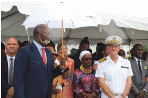
Élus de la Collectivité, représentants de l'État, de l'Éducation Nationale, Miss St-Martin / St Barthélemy, ministres de la partie néerlandaise, ... avaient tous convergés, malgré les averses, vers Quartier d'Orléans pour célébrer ce jour spécial et assister au traditionnel défilé.

Un vision partagée par le Président de la Collectivité qui a profité