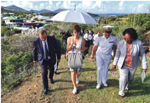
Première séquence dans les visites, le quartier d'Oyster Pond et l'épineux sujet de la frontière.