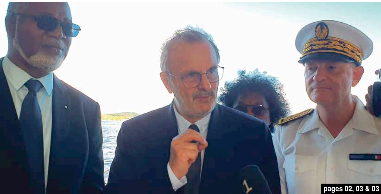
pages 02, 03 & 03

Le CSI cherche des réponses pour la jeunesse de Quartier d'Orléans