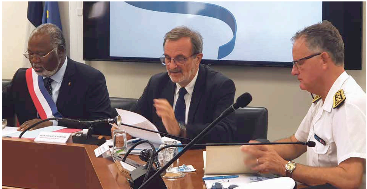
Séquence en Collectivité lundi matin où l'ensemble des élus, les parlementaires et autres personnalités politiques ont pu échanger avec le ministre sur des sujets importants pour le territoire.

Le président a également insisté sur l'importance d'un partenariat avec Action Logement pour apporter des solutions à la question prégnante du logement à Saint-Martin : « Mon observation de ce qui se passe sur le reste du territoire national me permet de dire que si ACTION LOGEMENT intervient à SAINT-MARTIN d'autres acteurs tel l'ANRU (Agence Nationale pour la Rénovation Urbaine), l'ANCT (Agence Nationale de Cohésion des Territoires), des financeurs comme la Caisse des Dépôts et Consignations (CDC) mais également l'Agence Française de Développement (AFD), veraient un intérêt à accompagner le développement sur ce territoire. L'intervention D'ACTION LOGEMENT nous faciliterait l'obtention de subventions et d'aides financières pour une vraie politique de renouvellement urbain dont le territoire a grandement besoin. Je de-