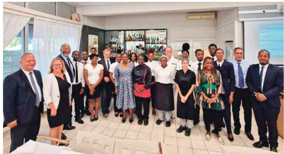
Le ministre Jean-François Carenc et les officiels ont déjeuné au restaurant Pédagogique du lycée professionnel.

A noter que la plupart des séquences prévues dans le déroulement de cette visite ministérielle qui se clôture ce mardi 18 octobre, se sont déroulées hors presse, le Ministère des Outre-mer ayant cloisonné les séquences « questions au