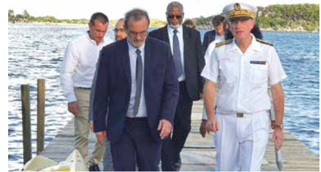
Détour à l'embarcadère de Cul de Sac où le sujet prégnant des sargasses a été discuté.

Les délégations ont ensuite retrouvé les acteurs socioéconomiques du tourisme lors d'une ronde organisée au Grand Case Beach