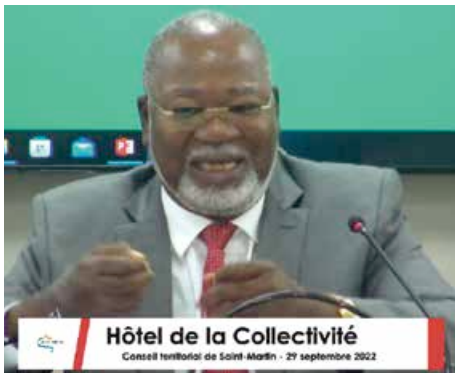
Hôtel de la Collectivité Conseil territorial de Saint-Martin - 29 septembre 2022

Lors du conseil territorial fleuve de jeudi dernier qui aura duré près de 8 heures, les élus ont débattu longuement sur le budget supplémentaire présenté par la nouvelle majorité. Le budget primitif 2022 présente un équilibre à 130 M€ dont 103.5M€ dédiés à l'investissement.