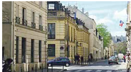
Actuellement située rue de Varenne, dans le 7e arrondissement, dans un appartement loué par la Collectivité, La Maison de Paris à Saint-Martin prendra prochainement ses quartiers dans un appartement du 8e arrondissement, dont la Collectivité se sera portée acquéreur.