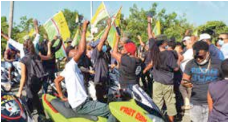
Photo d'archive du 16 septembre 2020, avec des milliers de personnes dans la rue, brandissant le drapeau de l'unité saint-martinoise, en protestation à la fermeture de la frontière décidée par la représentante de l'Etat dans le cadre de la crise sanitaire.

Présenté en séance du conseil territorial tenu hier matin en audience plénière, la délibération portant sur l'officialisation du drapeau « Unity Flag » comme symbole de l'affirmation de l'identité et de l'unité des deux parties de l'île, a suscité un long débat au sein de l'hémicycle.