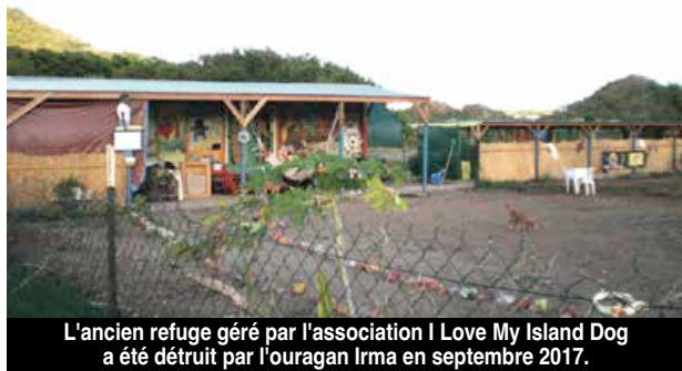
L'ancien refuge géré par l'association I Love My Island Dog a été détruit par l'ouragan Irma en septembre 2017.

Prégnant depuis cinq ans maintenant, le sujet de la création d'un refuge animalier semble aujourd'hui faire partie des priorités de la Collectivité. Une visite de terrain des élus et des techniciens est programmée pour demain, mercredi 14 septembre, en lieu et place de l'ancien refuge qui était alors géré par l'association I Love My Island Dog.