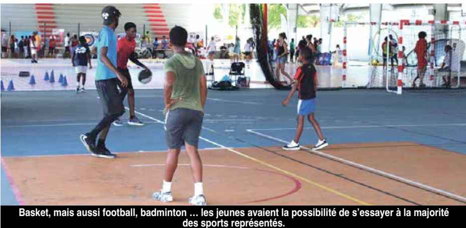
Basket, mais aussi football, badminton ... les jeunes avaient la possibilité de s'essayer à la majorité des sports représentés.