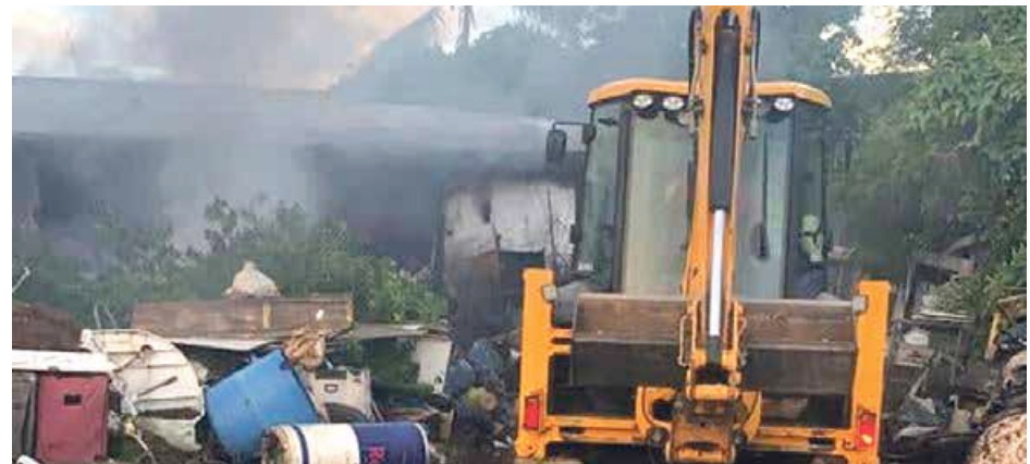
Les habitants de Quartier d'Orléans se sont mobilisés pour faire intervenir un de leur tractopelle afin d'aider au déblaiement.