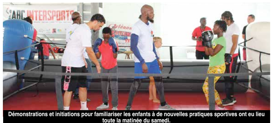
Démonstrations et initiations pour familiariser les enfants à de nouvelles pratiques sportives ont eu lieu toute la matinée du samedi.