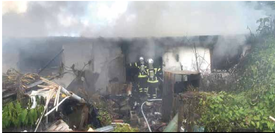
Un intervention pour les soldats du feu rendue encore plus compliquée du fait d'un amoncellement de bric-à-brac, susceptible de propager les flammes.

priété lieu du sinistre présentait à l'intérieur comme à l'extérieur, un parterre jonché de tout un tas de bric-à-brac, de voitures, d'objets et autres encombrants, rendant difficile l'accès des soldats du feu pour leur intervention. Une propriété par ailleurs éloignée d'une bouche d'incendie pour s'approvisionner en eau. Les résidents de Quartier d'Orléans ont alors mis en action toute une chaîne de solidarité pour porter assistance aux sapeurs-pompiers.