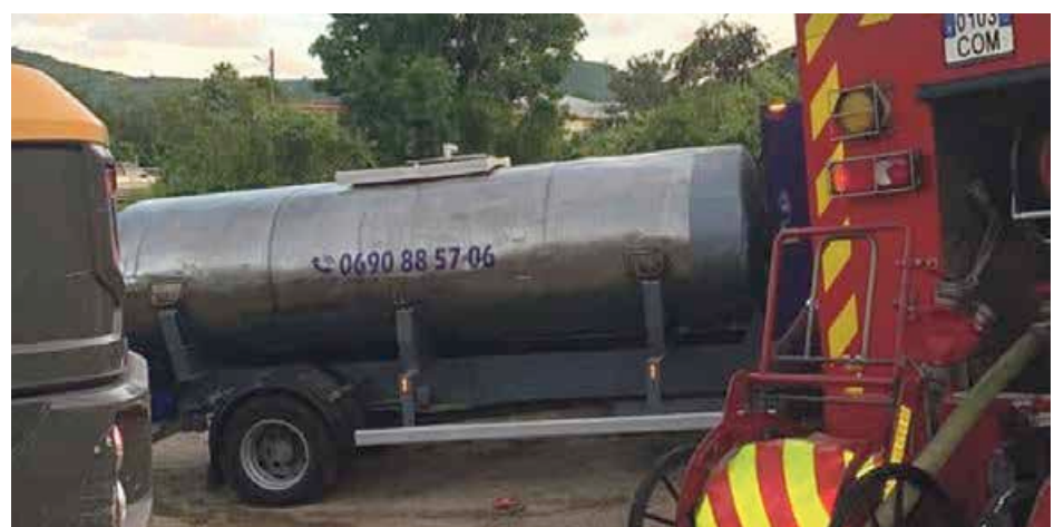
Les habitants se sont relayés et ont réalisé huit rotations depuis le point d'approvisionnement en eau à l'aide d'un camion-citerne.

OUVERT 7/7 À PARTIR DE 10H / BLVD DE GRAND CASE RÉSERVATION CONSEILLÉE 06 90 88 44 61