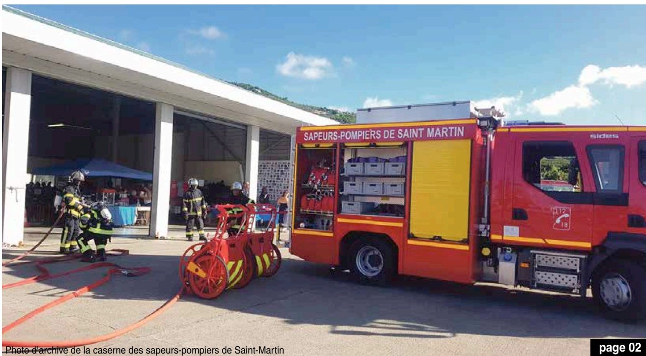
Photo d'archive de la caserne des sapeurs-pompiers de Saint-Martin