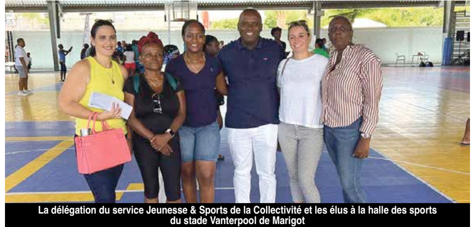
La délégation du service Jeunesse & Sports de la Collectivité et les élus à la halle des sports du stade Vanterpool de Marigot

Le club recherche actuellement des volontaires pour les postes de coach/entraîneurs et assistants, arbitre, officiel de table de marque. Des formations diplômantes seront organisées par le Comité Territorial de Basketball des îles du nord (CTBIN) tout au long de la saison sportive 2022-2023 afin de consolider le staff technique du club.