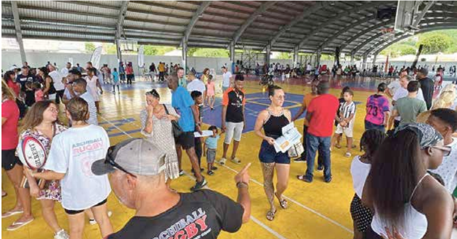
La journée porte ouverte des sports organisée samedi par la Collectivité a connu un franc succès.

Le public, était au rendez-vous samedi dernier pour rencontrer les clubs et associations sportifs lors de la journée porte ouverte organisée par la Collectivité. Pas moins de 27 associations et clubs étaient présents pour informer les jeunes sur leurs activités et peut être convaincre les indécis quant aux choix du sport pratiqué pour cette nouvelle saison.