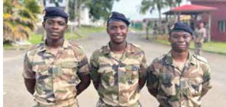
Trois des cinq jeunes Saint-Martinois engagés au RSMA Guadeloupe, qui défilent sur "la plus belle avenue du monde", ce jeudi 14 juillet.