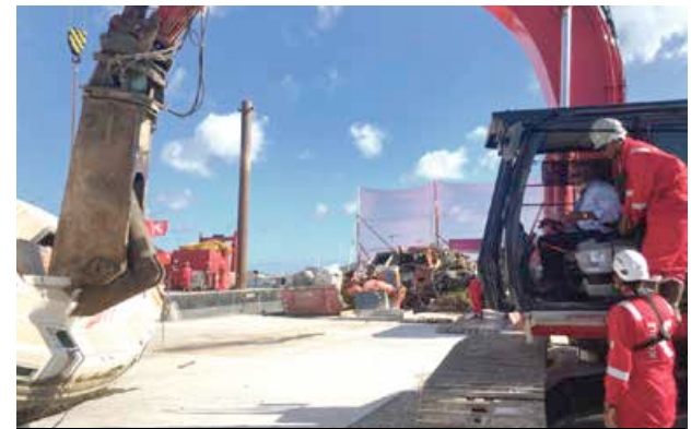
Le Président de la Collectivité, Louis Mussington, aux commandes pour le démantèlement du premier bateau.