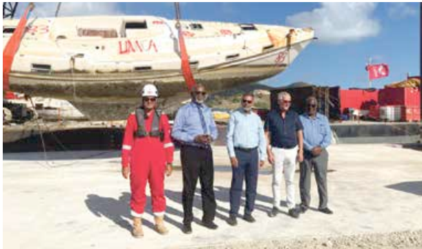
La société Koole Contractors qui a dépollué les eaux de la partie néerlandaise est maintenant à l'œuvre en partie française.

Comme annoncé, la première épave de bateau a été sortie de l'eau lundi, lançant officiellement le début du nettoyage des eaux de la partie française de l'île. L'enlèvement des épaves, pour un montant total de plus de 5 millions d'euros, est financé à 85% par l'Union Européenne, pour 444 000 € par la Collectivité de Saint-Martin et par l'État français pour le reste ... mais cela risque de ne pas être suffisant.