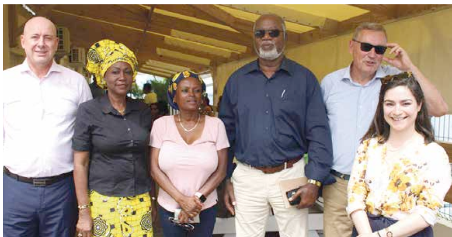
Visite terrain au centre de formation For'Idn pour le comité de suivi des fonds européens.

Un comité de suivi était organisé la semaine dernière sur les programmes européens réalisés à Saint-Martin de 2014 à 2020 et sur la mise en œuvre de ceux programmés pour la période 2021-2027, grâce aux fonds FEDER et FSE.