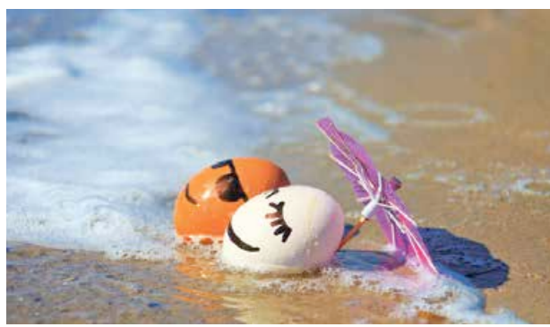
VENDREDI 15 AVRIL

A l'unisson, les deux parties de l'île fêteront Pâques durant ce long week-end avec, comme cela est la tradition, repas de familles, camping et vie chrétienne. Du vendredi Saint au lundi de Pâques, de nombreuses activités seront proposées, liées aux festivités pascales pour la plupart mais aussi à la vie locale. Petite sélection pour profiter de cette trêve.