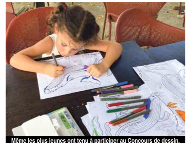
Même les plus jeunes ont tenu à participer au Concours de dessin.

En parallèle, un concours de dessin était organisé. Le dessin lauréat illustrera l'affiche de la prochaine édition, car la fête de la baleine devrait désormais s'inscrire dans le calendrier des animations pérennes de l'île. Rendez-vous en février l'année prochaine ! A.B