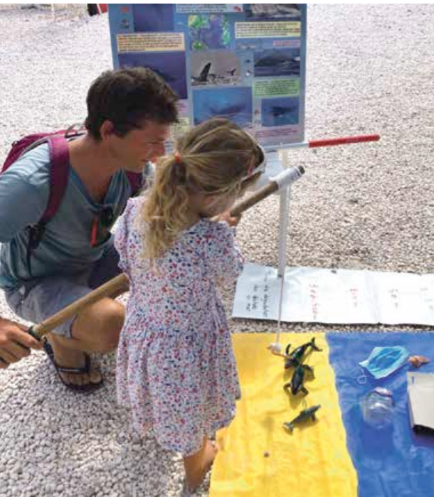
Mon école Ma Baleine s'était adapté aux plus petits avec des jeux ludiques.

La première édition de la fête de la baleine, organisée par Métimer, se tenait dimanche sur la place du village à la Baie Orientale. Retour en images, sur une animation très appréciée du public venu découvrir l'univers des cétacés de manière ludique ou plus sérieuse en rencontrant experts et scientifiques.