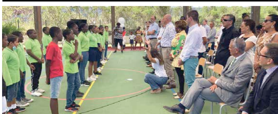
L'hymne de Saint-Martin, « O sweet Saint-Martin's Land » interprété par les élèves de l'école Émile Choisy de Concordia.