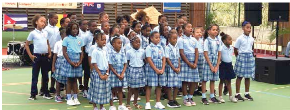
Les élèves de l'école Aline Hanson de Sandy Ground se sont lancé le défi de chanter en anglais, en français, en espagnol et en créole.