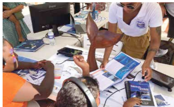
Agoa proposait d'écouter une histoire, racontée par une scientifique qui invitait l'auditeur à monter à bord d'un bateau puis à écouter, grâce à un hydrophone, les sons émis par différents cétacés (baleine à bosse, cachalot, ...).

après-midi sur leurs stands pour présenter l'univers sous-marin et tout l'enjeu de la protection de ces espèces. Les enfants des associations Five B et Sem Ta route de Quartier d'Orléans ont eux aussi eu le privilège de participer à cet événement.