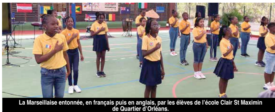
La Marseillaise entonnée, en français puis en anglais, par les élèves de l'école Clair St Maximin de Quartier d'Orléans.

De nombreuses manifestations sont prévues durant toute la semaine et sont ouvertes pour la plupart au public notamment deux conférences débat au lycée Robert Weinum à la Savane. La première, intitulée « Éducation sports et cultures » est programmée mercredi 6 avril de 18h à 20h et la seconde sur la thématique « l'histoire des langues à Saint-Martin », se tiendra le jeudi 7 avril de 18h à 20h. A.B