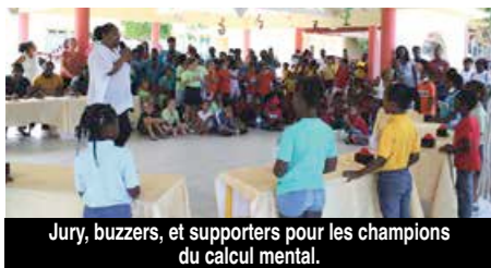
Jury, buzzers, et supporters pour les champions du calcul mental.

Dans le cadre de la semaine des Mathématiques, le Service Pédagogique de la CTOS organisait mercredi la Grande Bataille des Maths des accueils périscolaires. Durant deux heures, les élèves de six écoles maternelles et de huit écoles primaires ont pu participer à des activités autour de la thématique.