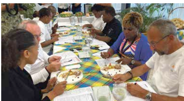
Épreuve ultime après la réalisation des plats, la dégustation par le jury, composé de membres de l'Office de Tourisme et des chefs qui ont animés cette quinzaine gastronomique.