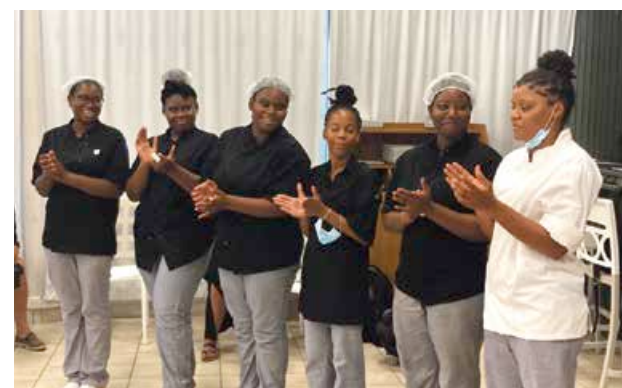
Les six candidates du premier concours des lycéens du Festival de la Gastronomie.