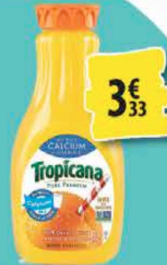
JUS TROPICANA 1,53L - différentes variétés 3€ 33