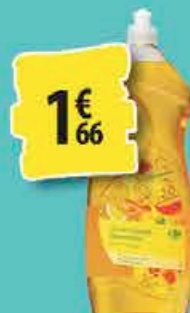
LIQUIDE VAISSELLE CARREFOUR 1,5L 1€ 66