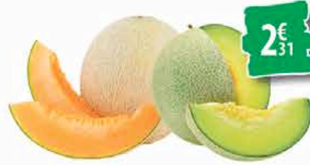
MELON CANTALOUPE OU HONEYDEW - la pièce 2€ 31