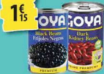
HARICOTS GOYA 434g - différentes variétés 1€ 15