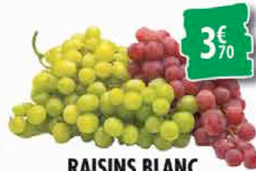
RAISINS BLANC OU ROUGES - le kg 3€ 70