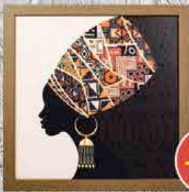
IMAGE ENCADRÉE ROSA