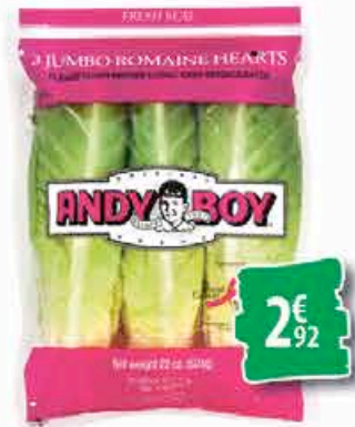
LAITUE CŒUR DE ROMAINE 3 pièces 2€ 92