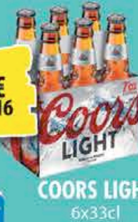
COORS LIGHT 6x33cl 4€ 16