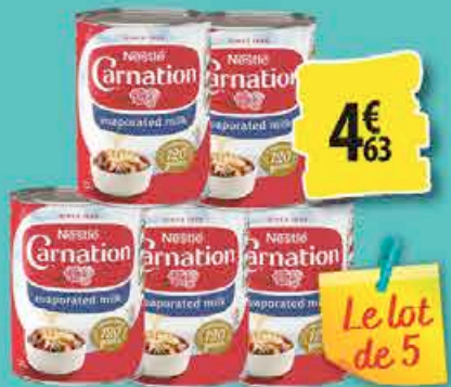
CARNATION 395g - le lot de 5 boîtes 4€ 63