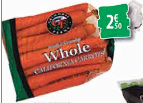
CAROTTES le sachet de 2,27kg 2€ 50