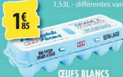
ŒUFS BLANCS EXTRA LARGES la douzaine 1€ 85