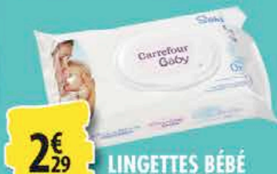
LINGETTES BÉBÉ CARREFOUR 2x72 lingettes 2€ 29