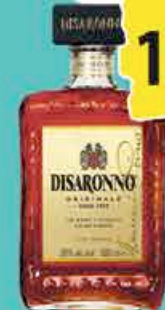
DISARONNO AMARETTO 1L 15€ 00