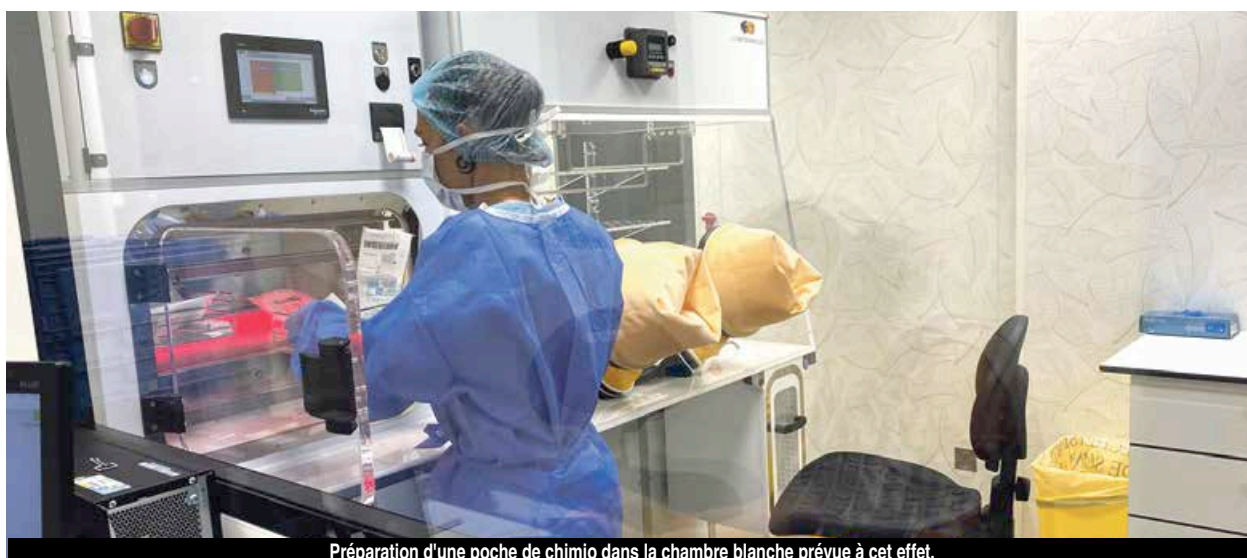
Préparation d'une poche de chimio dans la chambre blanche prévue à cet effet.