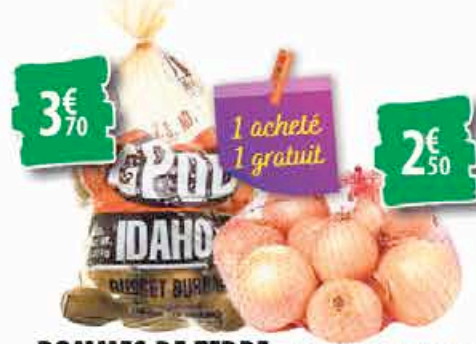
POMMES DE TERRE - le sachet de 5 LBS 3€ 70 OIGNONS JAUNES - le sachet de 3 LBS 2€ 50