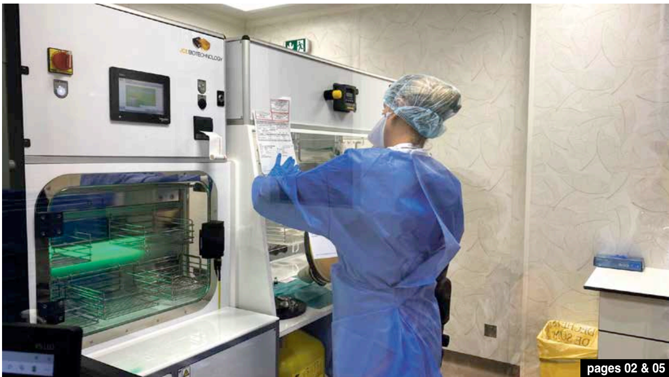
pages 02 & 05