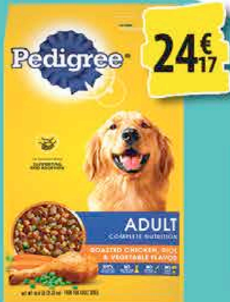
CROQUETTES POUR CHIEN PEDIGREE 25kg 24€ 17