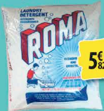
LESSIVE EN POUVRE ROMA 5kg 5€ 82