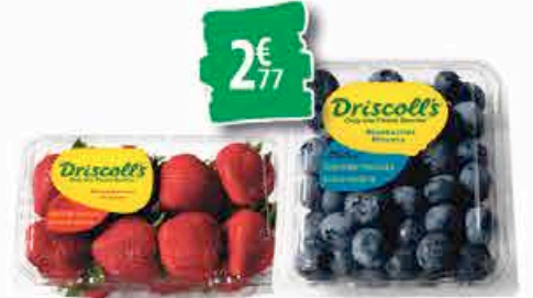
FRAISES 454g OU MYRTILLES 170g 2€ 77