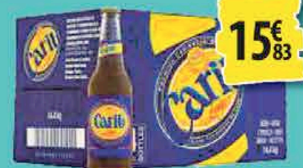
CARIB 24x33cl 15€ 83

1€ = $1,20 sur les encaissements en espèces