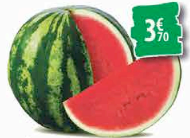
PASTÈQUE SANS PÉPINS - la pièce 3€ 70