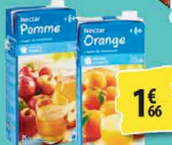
JUS DE POMMES OU D'ORANGES CARREFOUR 2L 1€ 66