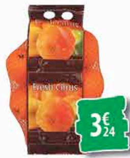
ORANGES - le sachet de 1,82kg 3€ 24