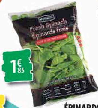
ÉPINARDS le sachet de 284g 1€ 85