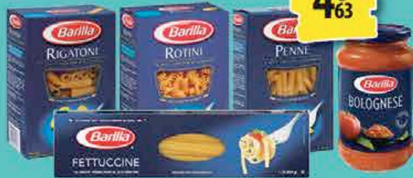
LOT DE 2 PAQUETS DE PÂTES BARILLA + 1 SAUCE BARILLA 4€ 63