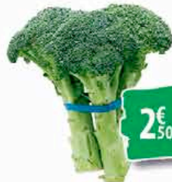
BROCOLI - Le kg. 2€ 50