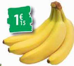
BANANES - le kilo 1€ 15