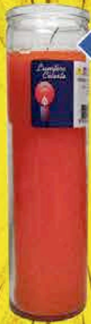
BOUGIE GRAND VERRE COLORÉ