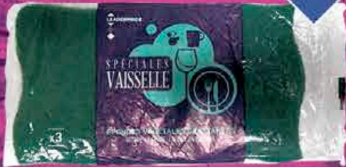
ÉPONGES GRATTANTES SPÉCIALES VAISSELLE LEADER PRICE X3