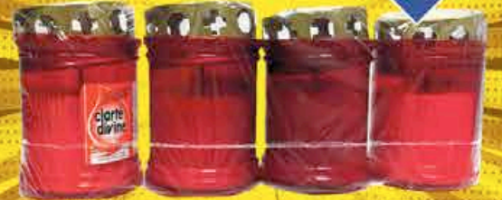
VEILLEUSE T20 PARAPLUIE X4