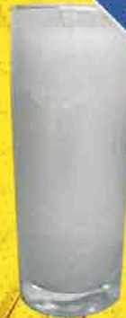
BOUGIE BILLY BLANC