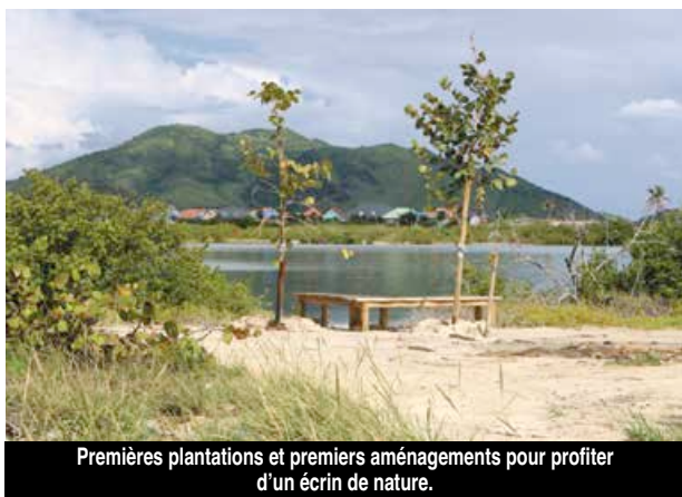
Premières plantations et premiers aménagements pour profiter d'un écrin de nature.

C'est donc un espace naturel et mieux préservé qui voit peu à peu le jour. La première phase de travaux vient de s'achever avec le nettoyage complet du site, la délimitation des sentiers, des parkings et la plantation de plus de 350 plants d'espèces endémiques. L'idée de baliser et de délimiter va, peut-être enfin permettre de limiter les déposes de déchets et autres actes d'incivilité sur cette plage majoritairement utilisée par les familles. Des accès spécifiques seront prévus pour les secours et les pêcheurs. Dans la seconde phase de travaux, sont prévus cinq carbets