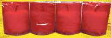
VEILLEUSE T10 X4