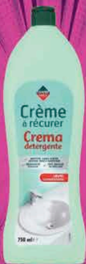
CRÈME À RÉCURER JAVEL LEADER PRICE 750ml soit 2,27€ le L