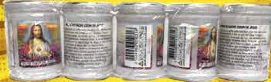
VEILLEUSE T20 IMAGE + PRIÈRE X5