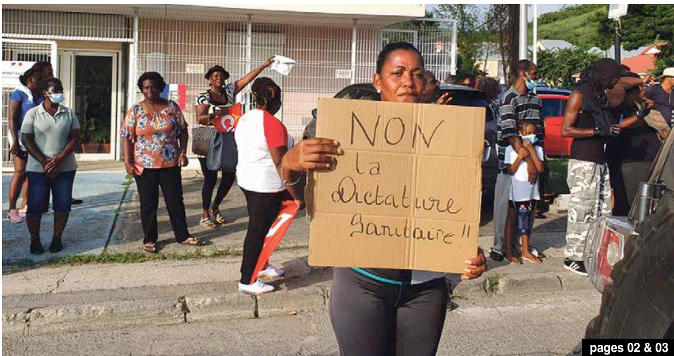
pages 02 & 03

Aménagement de la baie du Galion : un écrin nature