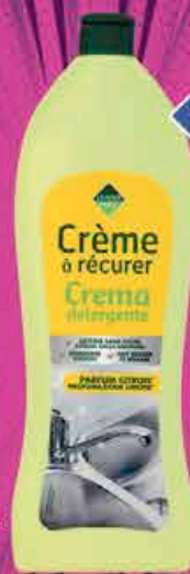
CRÈME À RÉCURER CITRON LEADER PRICE 750ml soit 2,07€ le L