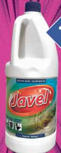
EAU DE JAVEL LEADER PRICE 2l soit 0,93€ le L

L'abus d'alcool est dangereux pour la santé, consommez avec modération. Suggestion de présentation. Photos non contractuelles. Dans la limite des stocks disponibles POUR VOTRE SANTÉ, PRATIQUEZ UNE ACTIVITÉ PHYSIQUE RÉGULIÈRE. WWW.MANGERBOUGER.FR