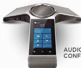
AUDIO CONFERENCE HD