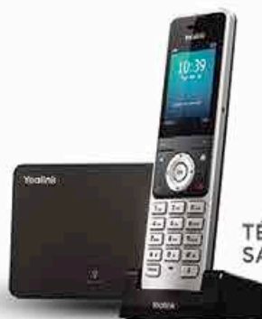
TÉLÉPHONIE IP SANS FIL