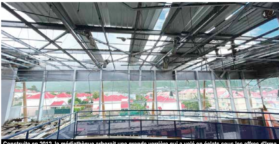
Construite en 2012, la médiathèque arborait une grande verrière qui a volé en éclats sous les affres d'Irma.

des Outre-mer / Europe). Un montant auquel il faut rajouter les 500 000 € consacrés aux prestations intellectuelles (bureaux d'études, architectes, etc.). Une seconde phase ultérieure à la réhabilitation du bâtiment prévoit l'aménagement des 1700m2 du terrain qui le jouxte en parcs et jardins botaniques, aire de jeux, etc. Cette seconde phase nécessitera une enveloppe supplémentaire de 1.7M€. A l'issue de la première phase de travaux de déconstruction, les travaux d'aménagement de l'espace culturel sont envisagés courant 2022 pour un achèvement en 2023. Quant à la phase d'aménagement des abords de la médiathèque en parcs de loisirs et jardins botaniques, les travaux pourraient démarrer en fin d'année 2022. V.D.