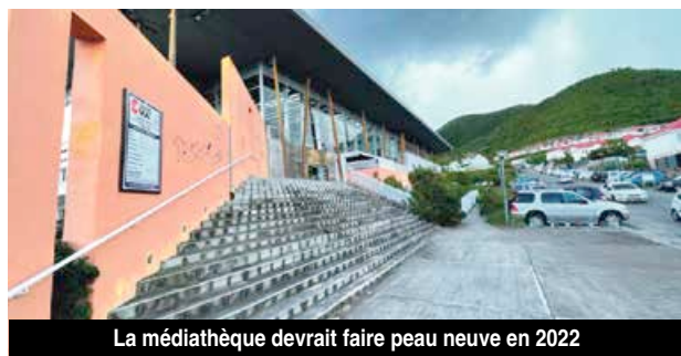
La médiathèque devrait faire peau neuve en 2022

Sur les trois niveaux préexistants, seuls deux seront préservés, le rez-de chaussée et le 1er niveau. La verrière qui a volé en éclats avec Irma sera entièrement déconstruite et le toit du