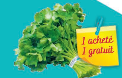
CORIANDRE LE BOUQUET & 1 acheté 1 gratuit