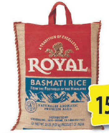
RIZ BASMATI ROYAL 30 LBS 15€ 42