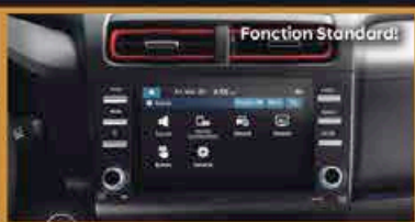
Écran Tactile 8 Pouces avec Android Auto/Apple Car Play