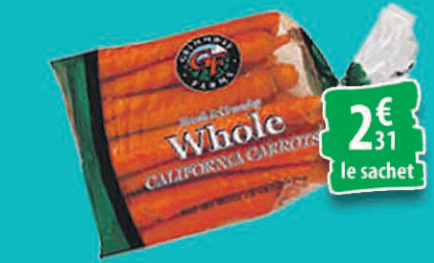
CAROTTES LE SACHET DE 5LBS 2€ 31