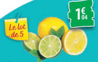
CITRONS JAUNES OU VERT LE LOT DE 5 PIÈCES 1€ 04