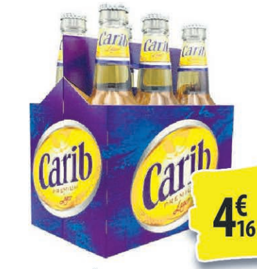
BIÈRES CARIB 6X330ML 4€ 16