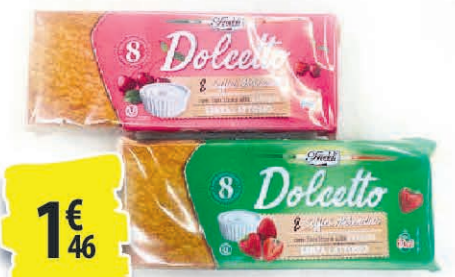
CAKE DOLCETTO DIFFÉRENTES VARIÉTÉS 200G 1€ 46