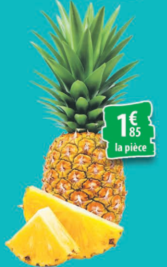
ANANAS LA PIÈCE 1€ 85