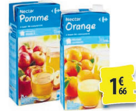
JUS DE POMMES OU D'ORANGE CARREFOUR 2L 1€ 66