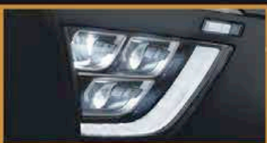
Phares LED Tri-Feux *Fonction Disponible

Frais d'immatriculation, TGCA, et Carte Grise incluses! 1ère révision gratis offert!