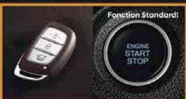
Clé Intelligente avec Démarrage par Pousse-Bouton