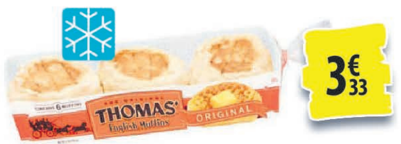
MUFFINS ANGLAIS THOMAS SURGELÉS DIFFÉRENTES VARIÉTÉS 12OZ 3€ 33