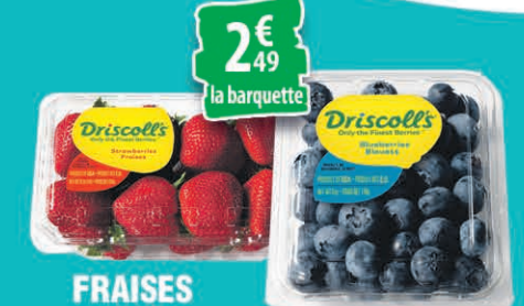
FRAISES LA BARQUETTE DE 16OZ 2€ 49 OU MYRTILLES LA BARQUETTE DE 6OZ