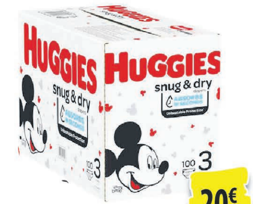
COUCHES HUGGIES DE LA TAILLE 1 À 6 20€ 83