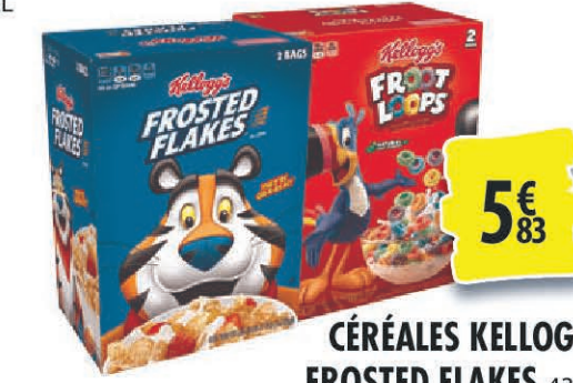
CÉRÉALES KELLOG'S FROSTED FLAKES 43,6OZ 5€ 83 OU FROOT LOOPS 55OZ