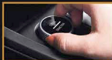
Contrôle de la Traction (Boue/Sable/Neige) *Fonction Disponible