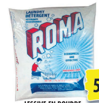
LESSIVE EN POUDRE ROMA 5KG 5€ 83