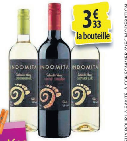
VIN INDOMITA DIFFÉRENTES VARIÉTÉS 75CL 3€ 33 la bouteille