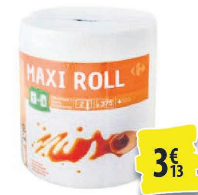
MAXI ROLL CARREFOUR LE ROULEAU 3€ 13