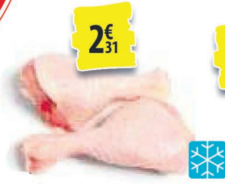
PILONS DE DINDE SURGELÉS LE KILO 2€ 31