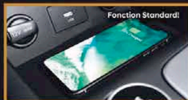
Bloc de Chargement sans Fil