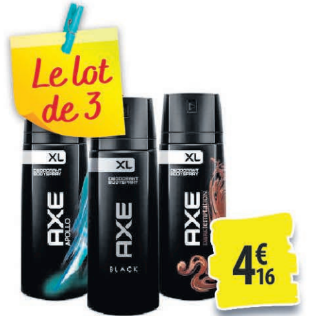
DÉODORANT SPRAY AXE DIFFÉRENTES VARIÉTÉS 150ML 4€ 16