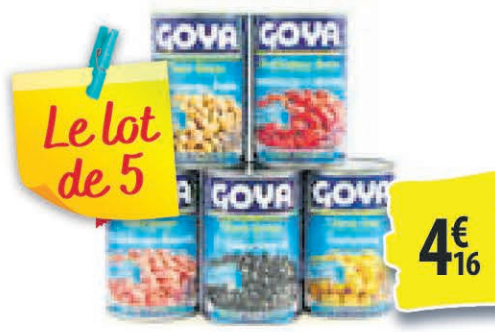
HARICOTS EN BOITE GOYA DIFFÉRENTES VARIÉTÉS 15OZ 4€ 16