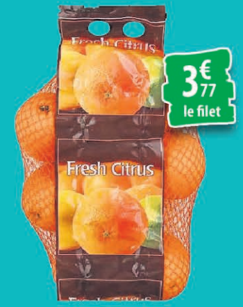
ORANGES LE FILET DE 4LBS 3€ 77