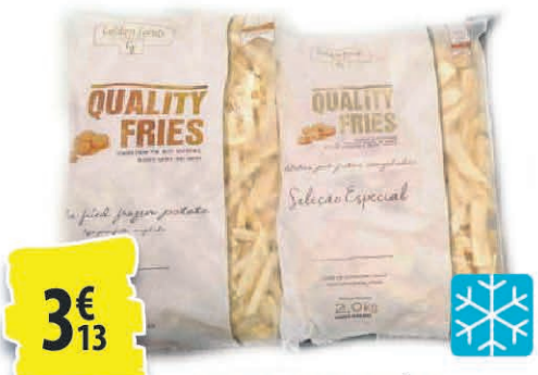
Frites surgelées DIFFÉRENTES VARIÉTÉS 2,5KG 3€ 13