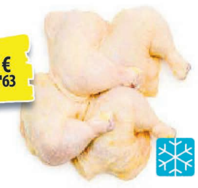
CUISSES DE POULET SURGELÉES 5 LBS 4€ 63