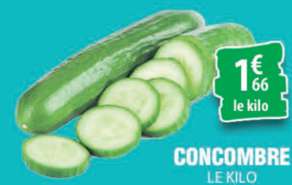
CONCOMBRE LE KILO 1€ 66