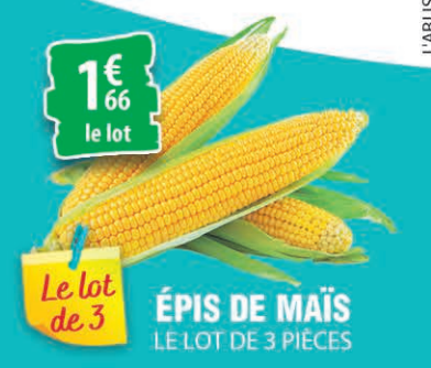
ÉPIS DE MAÏS LE LOT DE 3 PIÈCES 1€ 66 le lot

1€ = $1,20 sur les encaissements en espèces