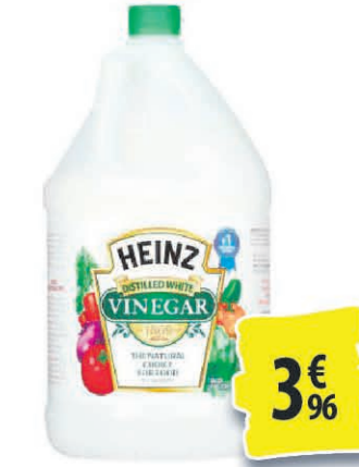
VINAIGRE BLANC HEINZ 1 GAL 3€ 96