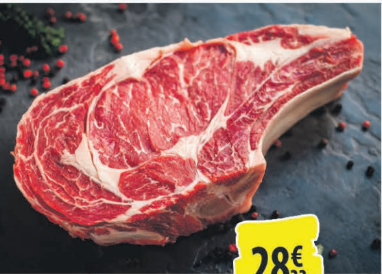
CÔTE DE BŒUF LE KILO 28€ 33