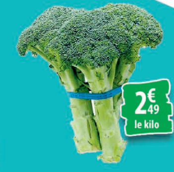
BROCOLI LE KILO 2€ 49