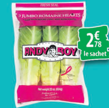
LAITUE ROMAINE LE SACHET DE 3 PIÈCES 2€ 78