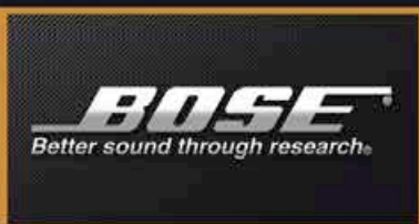
Système Audio Bose Premium *Fonction Disponible