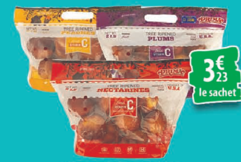
PÊCHES, PRUNES OU NECTARINES LE SACHET DE 2LBS 3€ 23