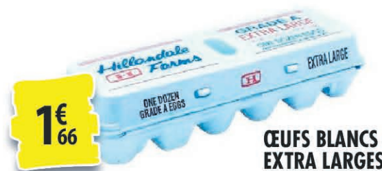
ŒUFS BLANCS EXTRA LARGES la douzaine 1€ 66