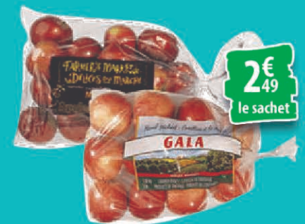
POMMES ROUGES OU GALA LE SACHET DE 3LBS 2€ 49