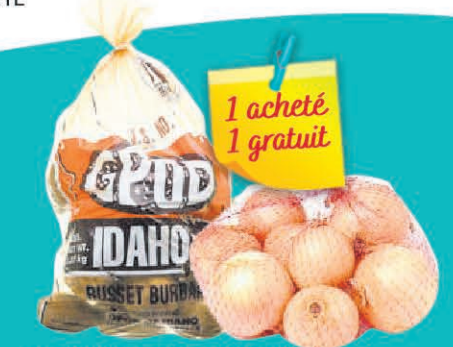
POMMES DE TERRE IDAHO LE SACHET DE 5LBS 1 acheté 1 gratuit OIGNONS JAUNES LE FILET DE 3LBS