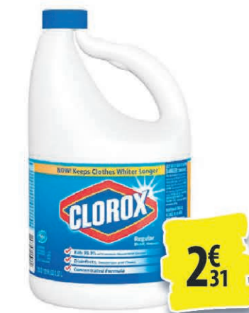
JAVEL CLOROX 128OZ 2€ 31