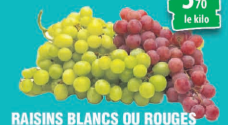
RAISINS BLANCS OU ROUGES LE KILO 3€ 70