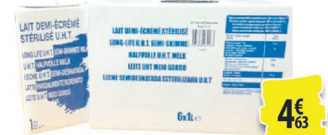
LAIT 1/2 ÉCRÉMÉ 6X1L 4€ 63