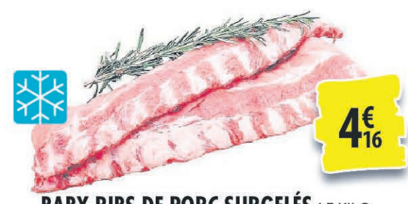
BABY RIBS DE PORC SURGELÉS LE KILO 4€ 16