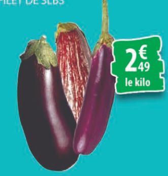
AUBERGINE LE KILO 2€ 49