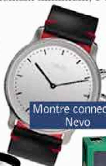
Montre connectée Nevo