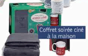
Coffret soirée ciné à la maison

> Compléter les informations ci-dessous et déposer votre bulletin à la Librairie des Isles