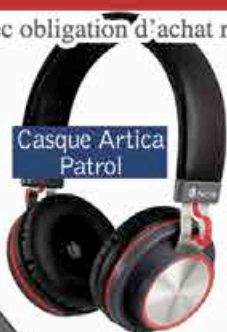
Casque Artica Patrol