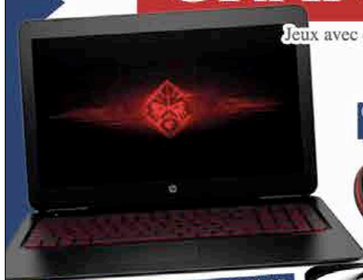
PC portable HP HP OMEN 15

Jeux avec obligation d'achat montant minimum, 1 euro. Coupon de participation à découper sur ce journal ou disponible à la librairie