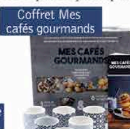
Coffret Mes cafés gourmands