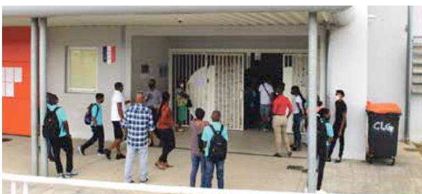
Les 6e ont découvert le Collège Soualiga pour la première fois en ce lundi matin.