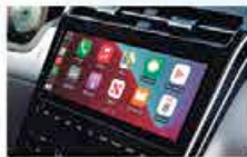
Écran Tactile 10,25 Pouces Avec Façade Centrale Entièrement Tactile