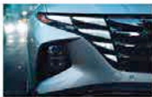
Phares Diurnes à LED à Signature Cachée Paramétrique