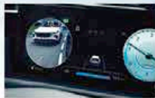
10,25 Pouces Cluster Numérique Ouvert Avec Caméras De Surveillance Des Angles Morts