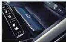
Bloc de Chargement Sans Fil Pour Smartphone