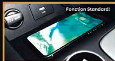
Bloc de Chargement sans Fil