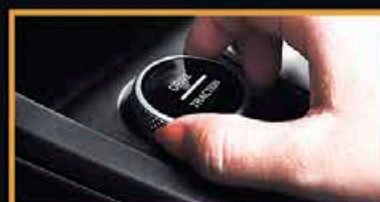
Contrôle de la Traction (Boue/Sable/Neige) *Fonction Disponible