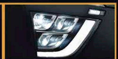
Phares LED Tri-Feux *Fonction Disponible

Frais d'immatriculation, TGCA, et Carte Grise incluses! 1ère révision gratis offert!