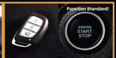
Clé Intelligente avec Démarrage par Pousse-Bouton