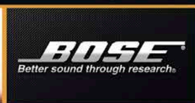
Système Audio Bose Premium *Fonction Disponible