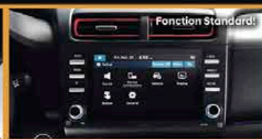
Écran Tactile 8 Pouces avec Android Auto/Apple Car Play