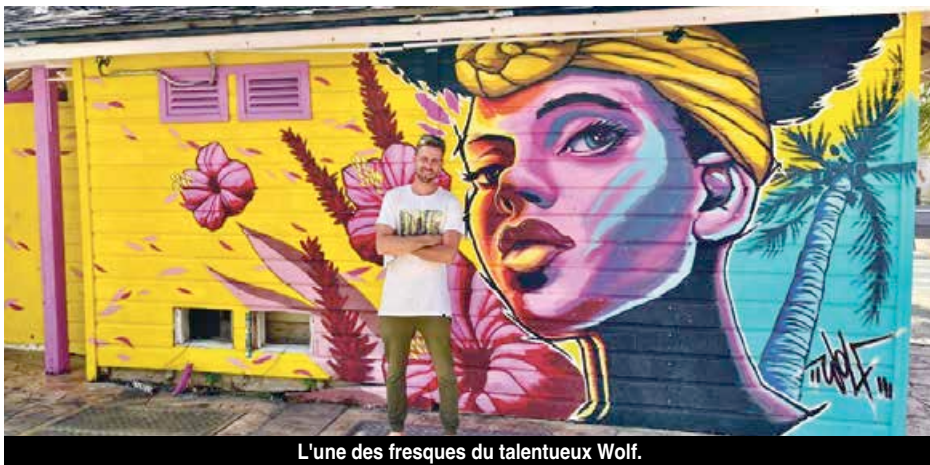
L'une des fresques du talentueux Wolf.

A l'instar de ce qui devient une tendance dans les grandes métropoles, le groupe « We Are SXM » initie une visite guidée des œuvres de street art qui fleurissent un peu partout, des deux côtés de l'île. Une première expérience « Island Art Tour » à vivre le samedi 29 mai.