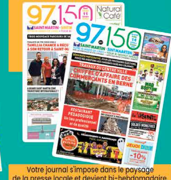
Journal de petites annonces