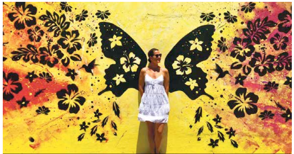
Pour des selfies originaux, il suffit de trouver les peintures murales de Sint Maarten ou Saint-Martin.