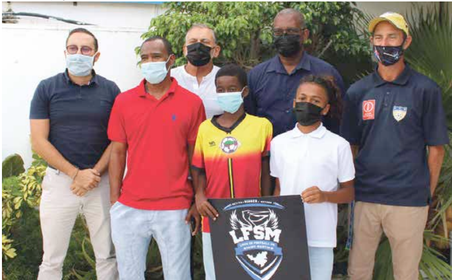
Annonce officielle de leur sélection par la Ligue de Football de Saint-Martin.