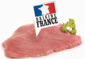
ESCALOPE DE VEAU 19.95 EUROS LE KILO