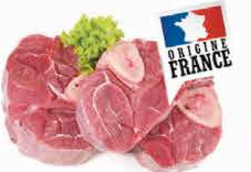
OSSO BUCCO DE VEAU 12.90 EUROS LE KILO