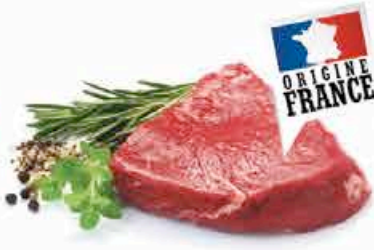
BOEUF BIFSTEACK 14.90 EUROS LE KILO