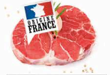
JARRET DE BOEUF 14.90 EUROS LE KILO