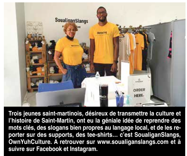
Trois jeunes saint-martinois, désireux de transmettre la culture et l'histoire de Saint-Martin, ont eu la géniale idée de reprendre des mots clés, des slogans bien propres au langage local, et de les reporter sur des supports, des tee-shirts... c'est SoualiganSlangs, OwnYuhCulture. A retrouver sur www.soualiganslang.com et à suivre sur Facebook et Instagram.