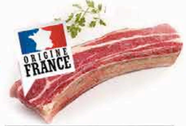
BOEUF PLAT DE COTE 9.90 EUROS LE KILO