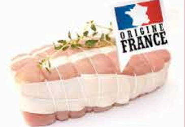
ROTI DE VEAU 17.95 EUROS LE KILO