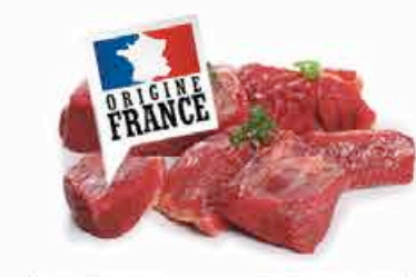
BOEUF POUR BOURGUIGNON 13.90 EUROS LE KILO