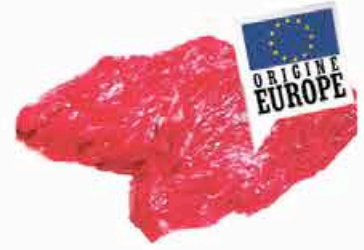
BAVETTE D'ALOYAU 12.90 EUROS LE KILO

PROMOTIONS VALABLES JUSQU'AU 23 MAI 2021