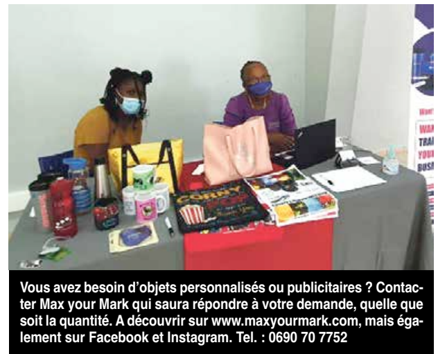
Vous avez besoin d'objets personnalisés ou publicitaires ? Contacter Max your Mark qui saura répondre à votre demande, quelle que soit la quantité. A découvrir sur www.maxyourmark.com , mais également sur Facebook et Instagram. Tel. : 0690 70 7752