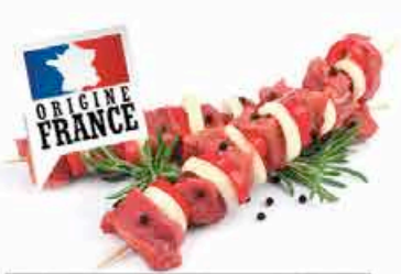
BROCHETTE DE BOEUF 16.90 EUROS LE KILO