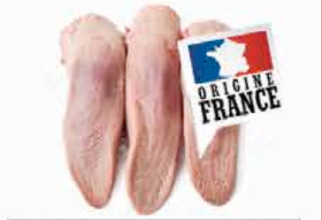
LANGUE DE BOEUF 9.95 EUROS LE KILO