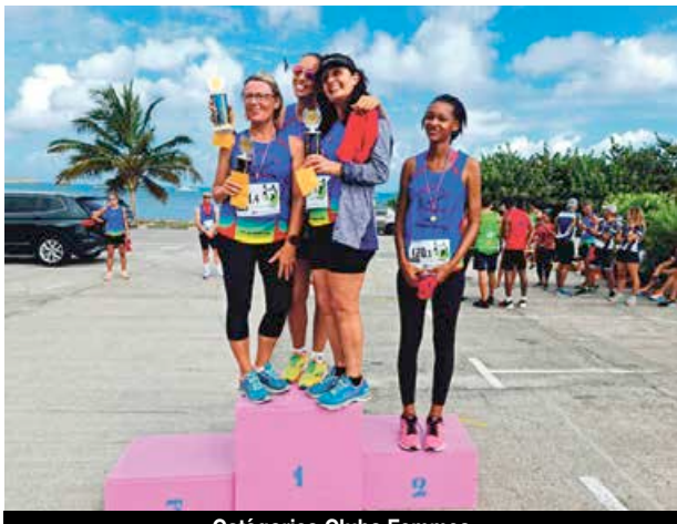
Catégories Clubs Femmes