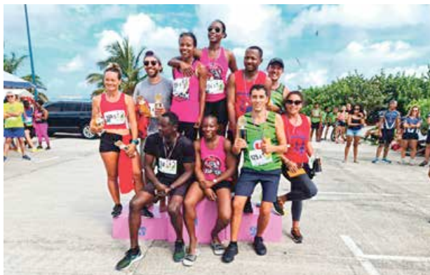
Catégorie Entreprises Mixtes