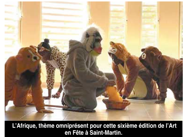
L'Afrique, thème omniprésent pour cette sixième édition de l'Art en Fête à Saint-Martin.

Une première exposition d'œuvres réalisées par ces derniers a été dévoilée jeudi dernier au collège de Quartier d'Orléans. Vendredi c'était au tour des élèves du collège Soualiga de présenter dans l'enceinte du collège Mont des Accords, une comédie musicale composée de différents tableaux inspirés des dessins animés de Disney et un défilé de mode africaine. Ces deux créations, qui ont pu naître grâce à la mobilisation des élèves mais également de tout le personnel enseignant et des parents, seront également présentées sur la scène du théâtre la Chapelle à la Baie Orientale le 22 mai prochain. Mais bien d'autres événements viendront ponctuer d'un peu de poésie ce mois de mai qui au-delà du thème imposé valorise ce qui ce fait au sens large dans les écoles autour de l'art. A.B