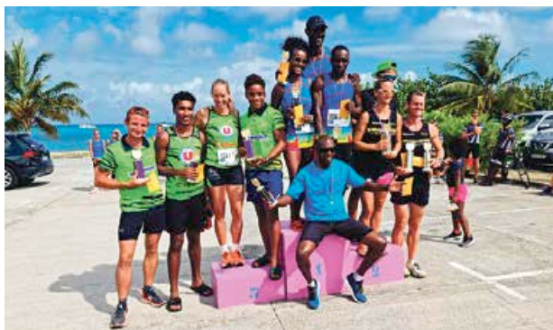
Catégorie Clubs Mixte

Catégorie Couple : 1 / PR ASCSM 39'11" - 2 / Le Duo 40'46" - 3 / Doranges Team ASCSM 45'48".