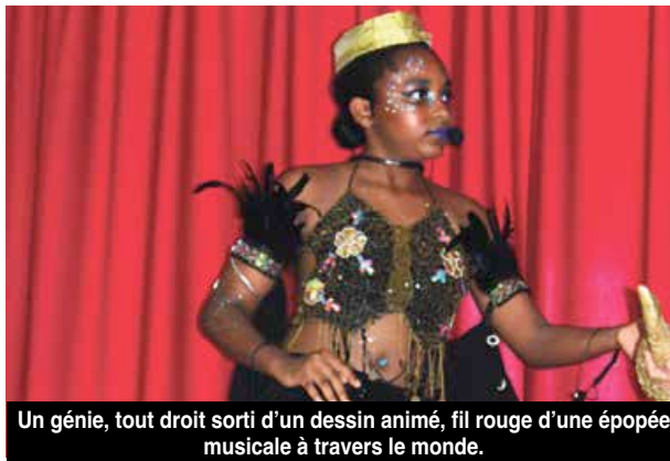
Un génie, tout droit sorti d'un dessin animé, fil rouge d'une épopée musicale à travers le monde.

L'affiche 2021 a été réalisée par Céline Renger, conseillère pédagogique Arts plastiques pour la circonscription du 1er degré des îles du Nord. L'Afrique étant faite de métissages, le visuel met en exergue ces particularités. En effet, le tissage qui lie les deux parties recomposées d'un visage, est le symbole du lien, des routes, du brassage, des cultures... Il s'agit également de la jonction entre l'Afrique ancestrale, représentée ici par une sculpture traditionnelle, et l'Afrique actuelle dont la reproduction est issue d'un artiste africain contemporain. Une source d'inspiration pour les créations des élèves de Saint-Martin.