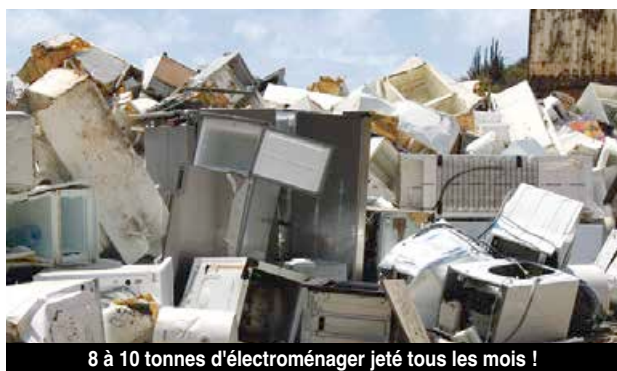
8 à 10 tonnes d'électroménager jeté tous les mois !

Une convention avait été signée avec le Conservatoire du Littoral pour pouvoir stocker temporairement les dizaines de milliers de tonnes de déchets dont plus de 4000 épaves de voitures, dans l'attente de leur traitement. Depuis décembre dernier, plus de 1500 tonnes de ferrailles ont été traitées et évacuées. Le site a pu être restitué au Conservatoire ce mois-ci. Des travaux de finition restent à réaliser pour lui redonner son aspect d'origine : création d'une pente