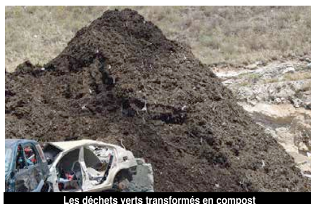
Les déchets verts transformés en compost

Tous les déchets verts sont broyés et stockés dans une fosse et se transforment en compost. Les sargasses en font partie à partir du moment où elles ne contiennent pas de sable. Les sociétés en charge du ramassage les amènent directement ou après les avoir laissées sécher, car pour le budget de la Collectivité un camion de sargasses sèches est bien moins onéreux que lorsqu'elles sont pleines d'eau.