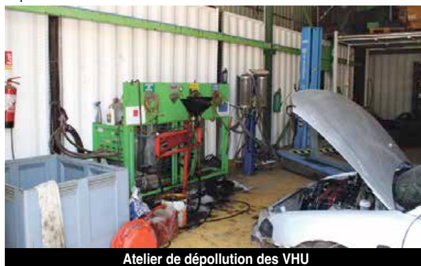
Atelier de dépollution des VHU

Un atelier spécifique dépollue entièrement chaque véhicule. Les liquides sont réutilisés sur les machines du site ou transférés en métropole pour être traités et régénérés dans l'usine de traitement OSILUB, où ils seront réutilisés pour faire de l'huile neuve, du carburant, des matières premières pour l'étanchéité des toitures ou encore de la valorisation énergétique. Les moteurs et pots catalytiques, qui contiennent des métaux précieux sont aussi recyclés, tout comme l'aluminium des jantes, le plastique, etc. Seules les batteries sont actuellement stockées dans l'attente d'une solution. Deux heures sont nécessaires pour traiter une voiture complète, beaucoup moins lorsqu'elle est à l'état de carcasse. La nouvelle presse à ferrailles permet d'accélérer le processus et les ballots sont ensuite expédiés par bateau en différents points de métropole. Verde SXM a également conclu un partenariat avec une société de la partie néerlandaise pour l'évacuation de la ferraille par barge, ce qui est plus rapide.