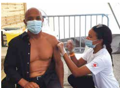
Le président Daniel Gibbs s'est rendu vendredi matin au vaccinodrome de Galisbay,

accompagné d'une partie de son cabinet, afin d'y recevoir la première injection du vaccin Pfizer. Le préfet Serge Gouteyron, déjà entièrement vacciné, était également présent, et tous les deux ont rendu hommage aux équipes de la Croix Rouge et aux équipes médicales, très mobilisées pour cette campagne de vaccination.