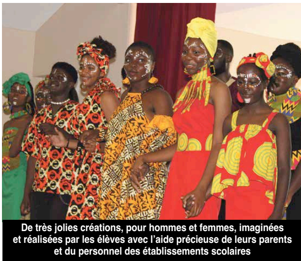
De très jolies créations, pour hommes et femmes, imaginées et réalisées par les élèves avec l'aide précieuse de leurs parents et du personnel des établissements scolaires

L'édition 2021 de « l'art en fête », est consacrée à l'Afrique. Plusieurs manifestations et expositions à l'initiative des élèves des différents établissements scolaires de l'île sont prévues tout au long de ce mois de mai.