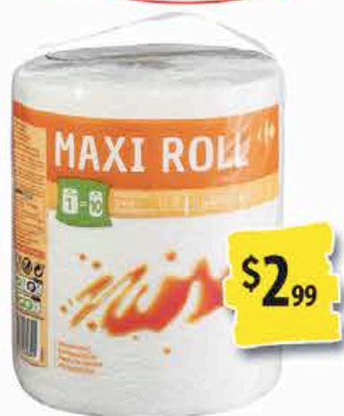
MAXI ROLL CARREFOUR LE ROULEAU