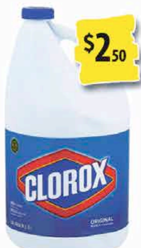
JAVEL CLOROX 128OZ