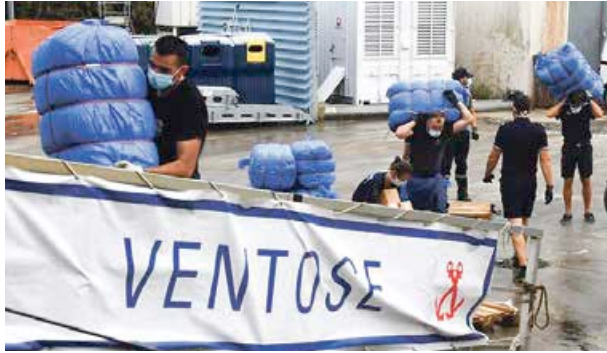
75 tonnes d'eau potable et 50 m3 de fret humanitaire vers Saint-Vincent, précise l'armée, dans un communiqué. V.D.

Au total, avec cette seconde rotation, les FAA auront acheminé