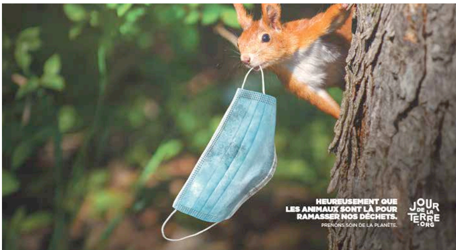
HEUREUSEMENT QUE LES ANIMAUX SONT LÀ POUR RAMASSER NOS DÉCHETS. PRENONS SOIN DE LA PLANÈTE. JOUR DE LA TERRE 2021

Le Earth Day a été célébré pour la première fois aux États-Unis le 22 avril 1970. Un premier cri d'alerte à une époque où il était encore possible d'inverser la tendance. Cinquante ans plus tard, une simple journée dans l'année ne suffira pas à sauver la planète et c'est chaque jour qu'il faut désormais agir.