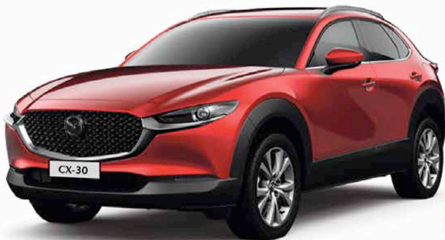
2021 | Mazda CX-30