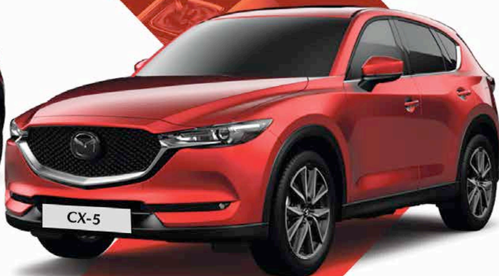
2022 | Mazda CX-5