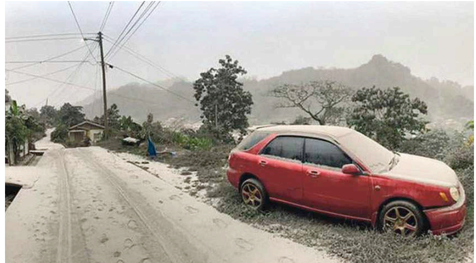
Recouverts de cendres, les paysages de l'île de Saint-Vincent ressemblent à des paysages enneigés...

Toutes les îles de la Caraïbe se tiennent prêtes à porter mains fortes à l'archipel de Saint-Vincent et des Grenadines. Hier, lundi 12 avril, un navire vénézuélien était programmé pour apporter de l'eau. En Guadeloupe aussi, les actions se multiplient, entre associations et organisations non gouvernementales. La Croix Rouge, par l'intermédiaire de sa plateforme d'Intervention Régionale en Amériques et aux Caraïbes (PIRAC), est fortement mobilisée et a déjà fait parvenir des ressources matérielles et humaines sur place. L'association Contacts et recherches Caraïbes (Coreca) est en relation avec