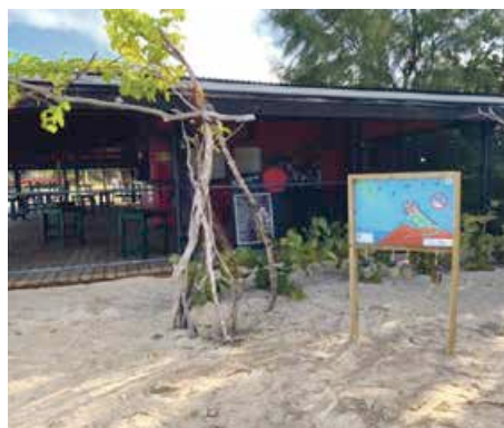
Ici, à Friar's Bay, un panneau de sensibilisation avec les boîtes-cendriers.

En plus d'être très utiles pour rappeler les bons gestes, ils sont très beaux. Les peintures ont été réalisées par les élèves de l'école Elie Gibbs sous la houlette de leur maîtresse Adeline Arnaud.