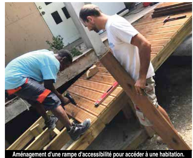
Aménagement d'une rampe d'accessibilité pour accéder à une habitation.