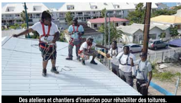
Des ateliers et chantiers d'insertion pour réhabiliter des toitures.

Toute l'éthique des Compagnons Bâisseurs réside dans l'auto-réhabilitation. Ainsi, à côté des travaux urgents de réhabilitation d'une vingtaine de toitures, les Compagnons Bâisseurs organisaient dès les premiers mois de janvier 2018, des sessions de sensibilisation, d'information et de formation sur la réparation des charpentes et couvertures des habitations, qui ont eu lieu pendant plusieurs semaines, à Quartier d'Orléans, où une maquette de charpente de toiture était installée, à des fins pédagogiques. En juillet 2018, débutait la seconde phase du projet, comportant la réhabilitation de quelque 120 toitures, ainsi que l'accompagnement d'une quarantaine de familles à l'auto-réhabilitation, dans 4 quartiers de l'île : Quartier d'Orléans, Sandy Ground, Agrément et Grand Case. Cette seconde mission s'est achevée avec succès en décembre 2019, où environ 140 familles saint-martinoises ont été mises à l'abri, un nombre au-delà donc de ce qui était programmé, sur les mêmes fonds.