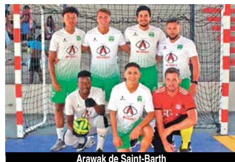
Arawak de Saint-Barth

Chez les séniors, six équipes étaient en lice : la team Bellevue, celle de Grand Case, les Flamingo de Marigot, une sélection U17 de Concordia, et deux équipes de Saint-Barthélemy, les Arawak et la Team FWI. L'équipe Les Arawak s'est attribuée la plus haute marche du podium, devant la sélection des U17. Les Saint-Barths du Team FWI se sont placés en 3e position et la Team Bellevue a terminé à la 4e place. La formation des Arawak a rafilé également la Coupe du meilleur joueur, ainsi que la Coupe du meilleur gardien. La Coupe du meilleur buteur a été décernée à la Team Bellevue. Chez les U15, cinq équipes étaient en compétition. C'est l'équipe de Concordia qui a remporté le tournoi, devant les All Stars et la formation de Sandy Ground.