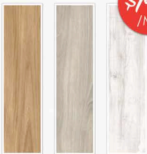
OPERA/ BORGHETTO 20X75 CM • CARRELAGE SOL/MUR GRES CERAME • INTERIEUR/EXTERIEUR DISPONIBLE EN 3 COLORIS