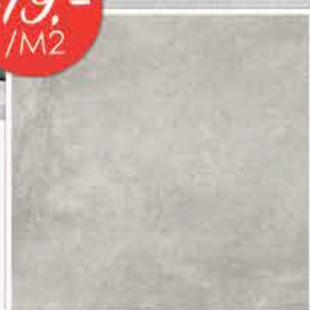
GROUND 60X60CM • CARRELAGE SOL GRES CERAME • RECTIFIE DISPONIBLE EN 2 COLORIS