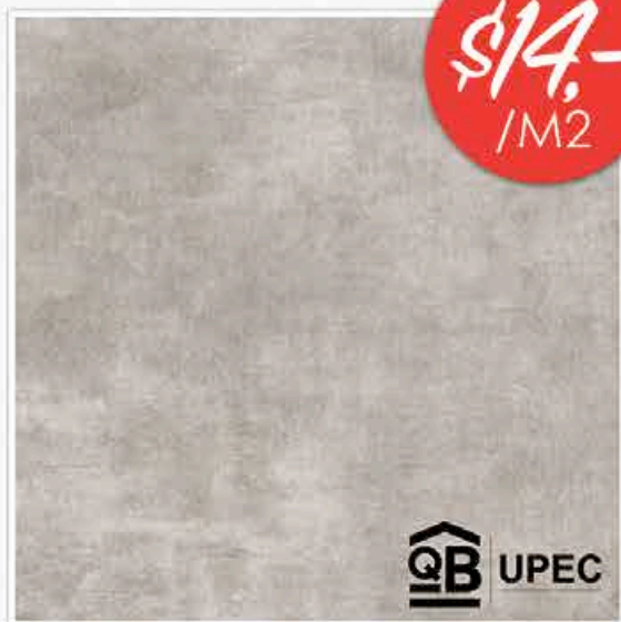
CORTALS 45X45CM • CARRELAGE SOL • GRES CERAME INTERIEUR/EXTERIEUR DISPONIBLE EN 2 COLORIS

HDPROSELECT FOR PROFESSIONALS. BY PROFESSIONALS