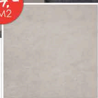
ATACAMA 45X45CM • CARRELAGE SOL GRES CERAME • PLEINE MASSE