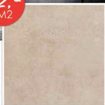
FOSTER/MEIER 45X45CM • CARRELAGE SOL INTERIEUR/EXTERIEUR DISPONIBLE EN 2 COLORIS