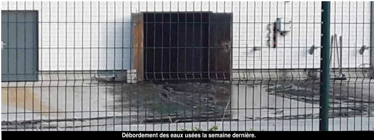
Débordement des eaux usées la semaine dernière.

La station d'épuration de Quartier d'Orléans a connu la semaine dernière un souci de maintenance qui a occasionné d'importants désagréments pour les riverains et suscité leur inquiétude. L'EEASM, interrogée, se veut rassurante et donne quelques explications.