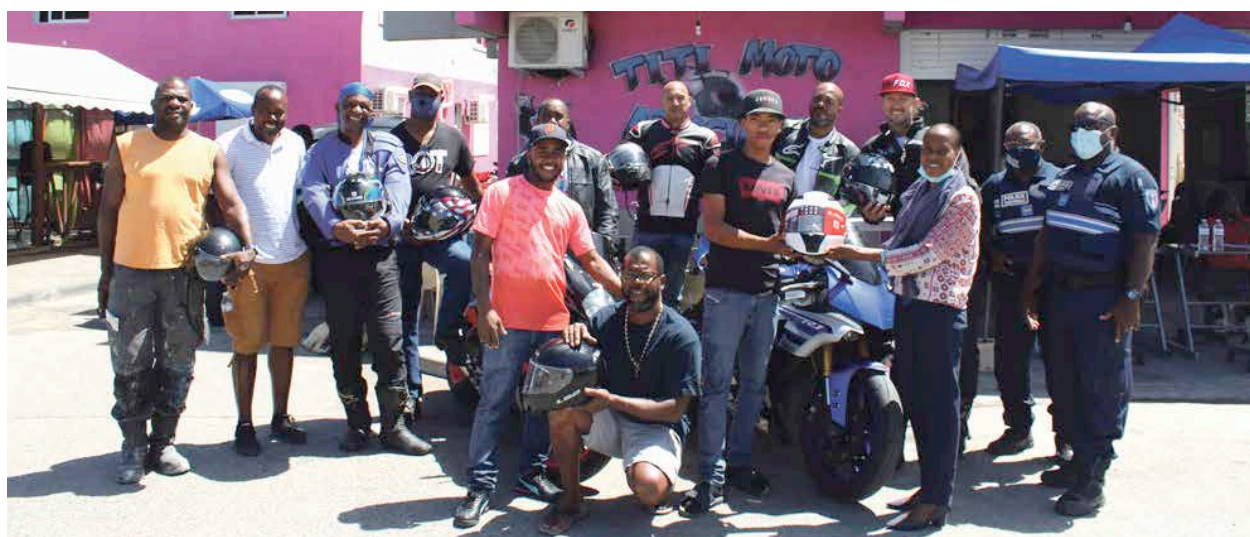
"Jamais sans mon casque" : l'opération du CSI mobilise les motards de l'île.