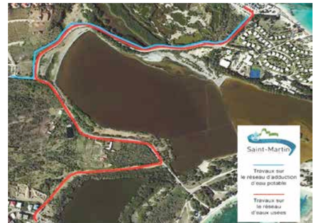
Le plan des nouvelles canalisations autour de l'étang des Salines