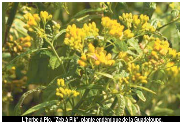
L'herbe à Pic, "Zeb à Pik", plante endémique de la Guadeloupe.