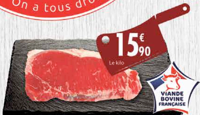
FAUX FILET BIO - Le kg. ORIGINE FRANCE - AU RAYON BOUCHERIE