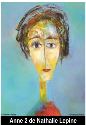
Anne 2 de Nathalie Lepine

Périodiquement la Tropismes Gallery offre des pauses intemporelles en faisant découvrir les œuvres d'artistes locaux ou de plus loin.