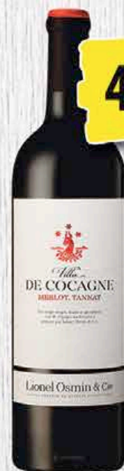
VILLA DE COCAGNE MERLOT, TANNAT 75CL

1€ = $120 sur les encaissements en espèces