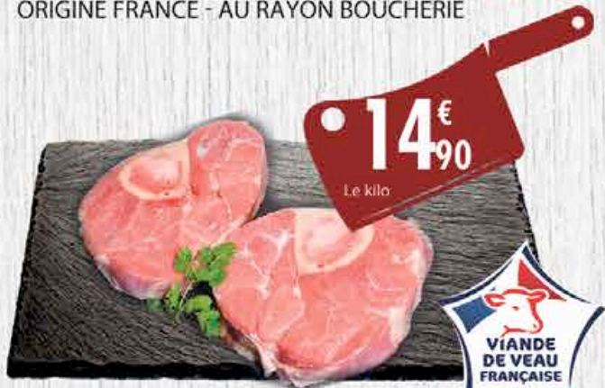
OSSO BUCO VEAU - Le kg. ORIGINE FRANCE - AU RAYON BOUCHERIE