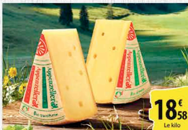
APPENZELLER - Le kg. AU RAYON FROMAGES À LA COUPE