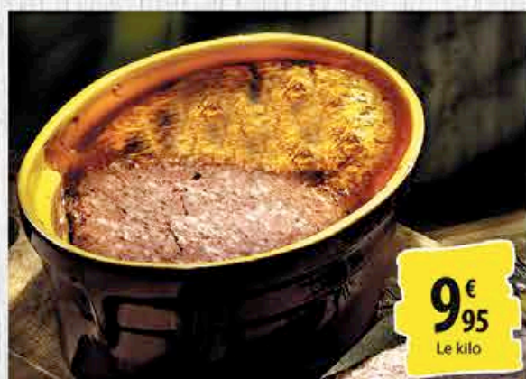
TERRINE DE CAMPAGNE - Le kg. ORIGINE FRANCE - AU RAYON CHARCUTERIE À LA COUPE