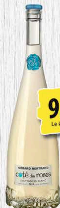
COTE DES ROSES SAUVIGNON BLANC 75CL