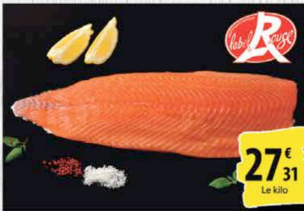
FILET DE SAUMON LABEL ROUGE - Le kg. ORIGINE ÉCOSSE - AU RAYON POISSONNERIE