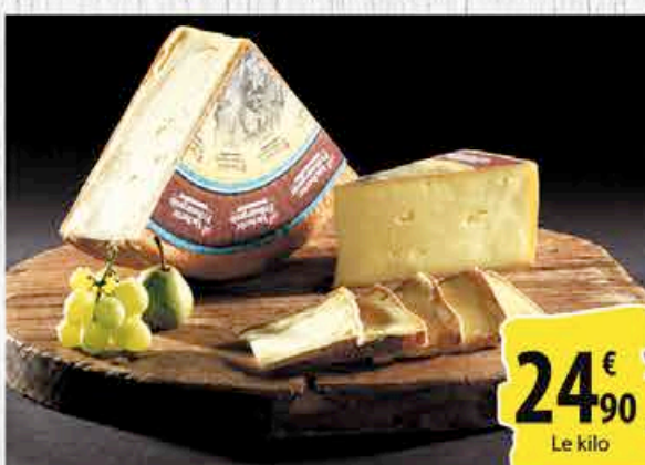
VACHERIN DE FRIBOURG - Le kg. AU RAYON FROMAGES À LA COUPE