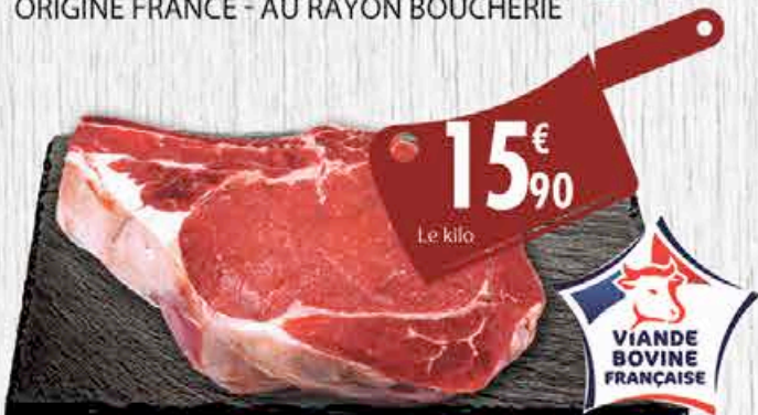
CÔTE DE BŒUF BIO - Le kg. ORIGINE FRANCE - AU RAYON BOUCHERIE