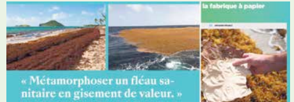
« Métamorphoser un fléau sanitaire en gisement de valeur. »

A peine deux ans après sa création et avoir remporté le prix « Start » du concours innovation Outre-Mer, la startup Sargasse Project vient de déposer un second brevet de propriété intellectuelle, envisage l'implantation de la première fabrique de pâte à papier en Guadeloupe et suscite l'intérêt des industriels, mais aussi des médias de l'autre côté de l'Atlantique. Et pour cause : ce projet pourrait constituer l'une des solutions pour limiter l'impact des algues brunes.