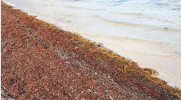
Embarcadère de Pinel, dimanche 14 février ... de premiers échouages, mais encore modérés.

Depuis 2011, le problème de l'échouage massif des sargasses est récurrent et sur des périodes de plus en plus longues. Les plages ont reçu les premiers arrivages, encore minimes, mais ce n'est que le début. Les radeaux détectés au large dans l'Atlantique sont actuellement contrariés par les courants marins, mais ils devraient atteindre Saint-Martin sous quinze jours à trois semaines.