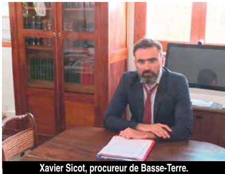
Xavier Sicot, procureur de Basse-Terre.

Le drame qui a secoué le village de Grand Case au petit matin de lundi dernier, faisant trois victimes, deux hommes et une femme, a laissé place à de nombreuses extrapolations sur les réseaux sociaux et une certaine presse. A ce stade de l'enquête, le procureur de Basse-Terre saisi dans cette affaire, Xavier Sicot, nous a livrés hier, de tous premiers éléments officiels.