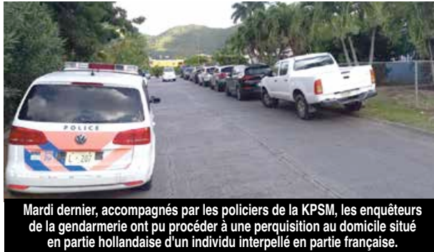
Mardi dernier, accompagnés par les policiers de la KPSM, les enquêteurs de la gendarmerie ont pu procéder à une perquisition au domicile situé en partie hollandaise d'un individu interpellé en partie française.

Ce sont ainsi une quarantaine de véhicules qui ont été dernièrement saisis, et les propriétaires ont été inquiétés pour recel de biens : « des particuliers qui avaient acheté ces véhicules d'occa-