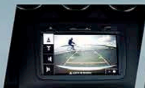
Caméra de recul

À partir de maintenant et jusqu'au 10 Février