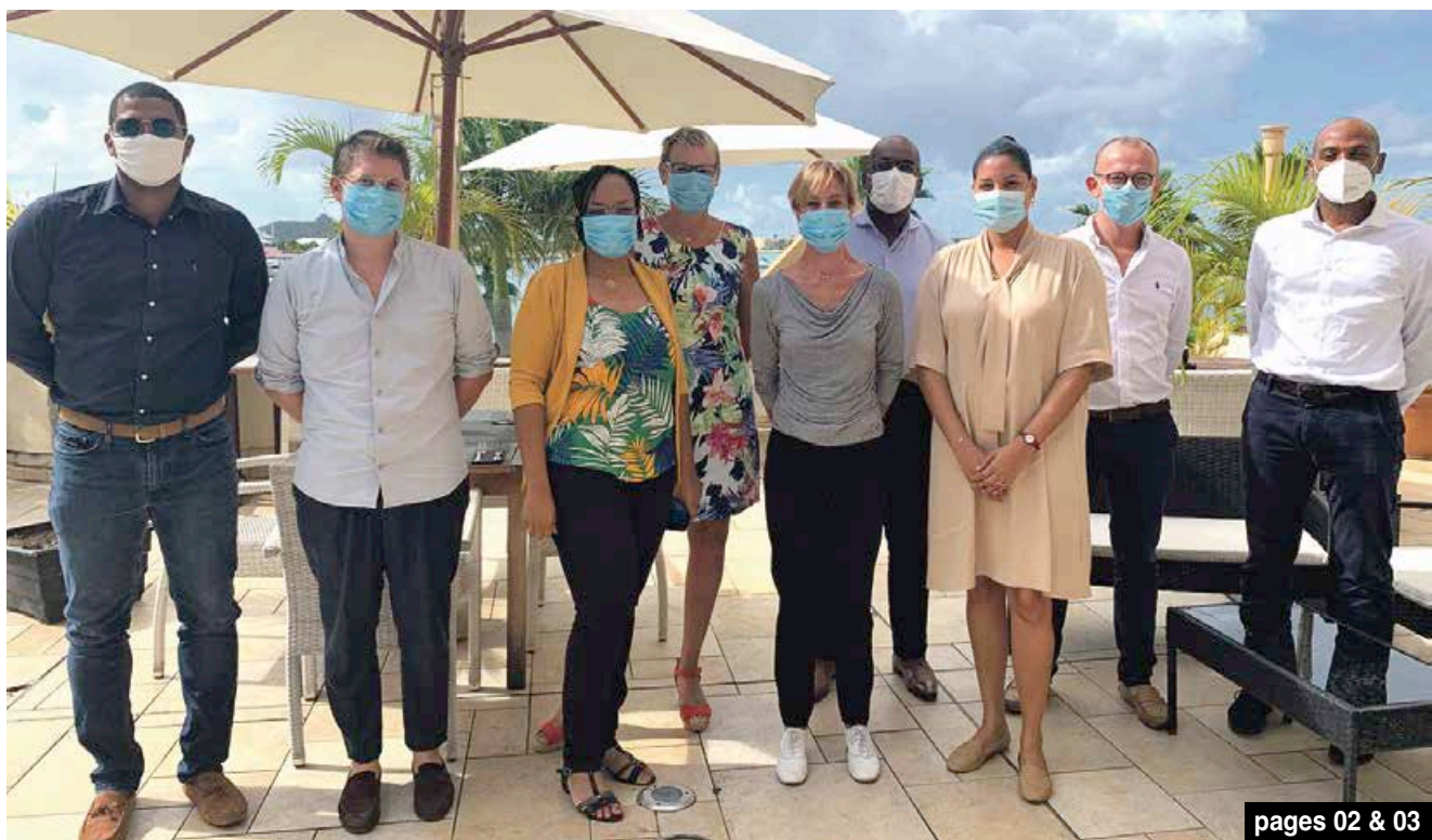
pages 02 & 03