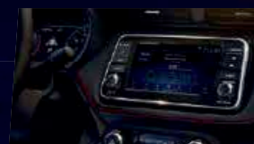
NissanConnect® 7" écran tactile