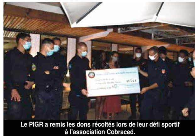
Le PIGR a remis les dons récoltés lors de leur défi sportif à l'association Cobraced.

font partager aux plus jeunes. Quatre d'entre eux découvraient Saint-Martin pour la première fois, satisfaits de pouvoir changer de la routine des missions habituelles. Mais, ils avouent que la tâche n'est pas si aisée et déplorent que beaucoup aient une image négative de leur fonction.