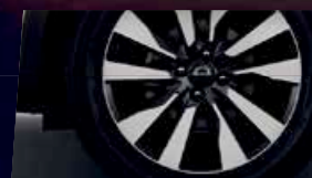
Jantes en alliage alu 17"