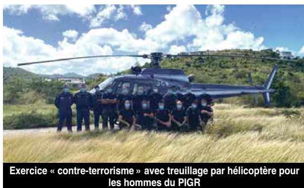
Exercice « contre-terrorisme » avec treuillage par hélicoptère pour les hommes du PIGR

374 km parcouru à la rame en 24h et 4154 € de dons récoltés, c'est le défi réussi des seize hommes du peloton d'intervention de la Garde Républicaine actuellement stationnée à Saint-Martin. Une somme qu'ils ont remis à l'association Cobraced la semaine dernière pour lui permettre d'amplifier ses actions.