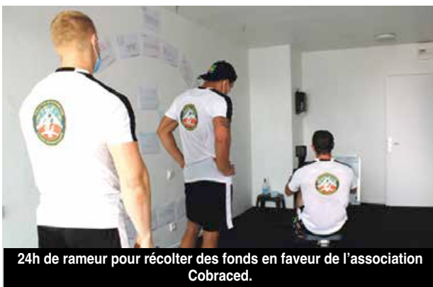
24h de rameur pour récolter des fonds en faveur de l'association Cobraced.

Les plus anciens avouent un attachement particulier à l'île et sont heureux d'y revenir à chaque fois avec la même motivation, qu'ils