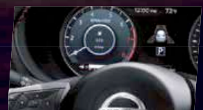
Écran d'assistance avancé à la conduite de 7"