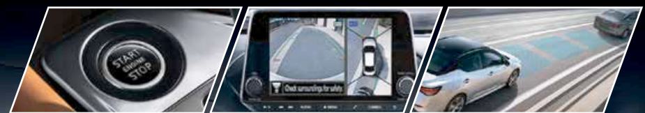
Démarrage par bouton poussoir