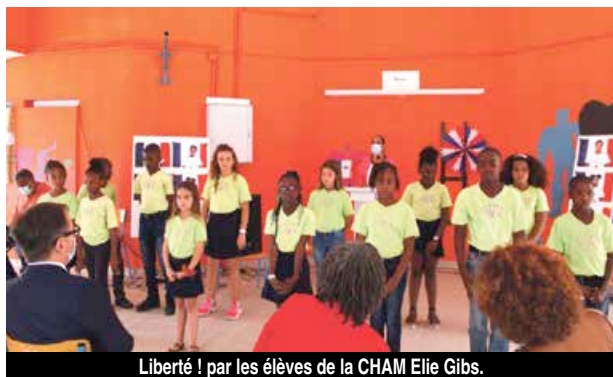
Liberté ! par les élèves de la CHAM Elie Gibs.