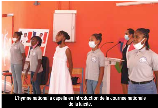
L'hymne national a capella en introduction de la Journée nationale de la laïcité.

Il était évident que cette journée allait résonner différemment dans les cours d'écoles cette année. Professeurs et élèves de tous les établissements scolaires français ne pouvaient travailler ensemble sur ce thème sans penser à Samuel Paty, professeur d'histoire-géographie assassiné le 16 octobre. Cette journée lui était dédiée.