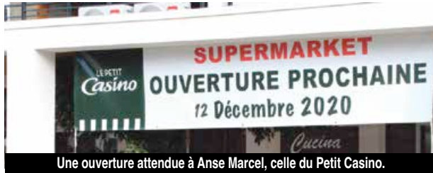
Une ouverture attendue à Anse Marcel, celle du Petit Casino.

Les gravas des chantiers disparaissent, les épaves de bateau ont été enlevées, la marina retrouve son lustre d'antan, les réouvertures des établissements s'annoncent. Une plage, deux restaurants, des excursions bateaux ou plongées et ... une épicerie ! Bienvenue au paradis.