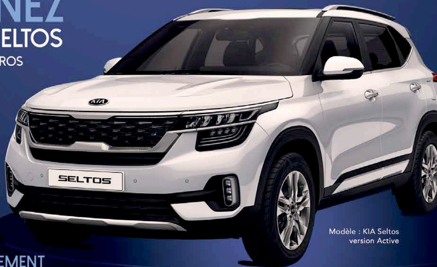
Modèle : KIA Seltos version Active