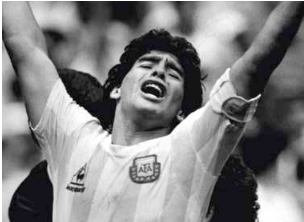
Diego Maradona : une légende s'en est allée. Le monde du football pleure à l'unisson la disparition de ce joueur de génie, décédé d'une crise cardiaque à 60 ans le 25 novembre. Trois jours de deuil national ont été décrétés en Argentine.