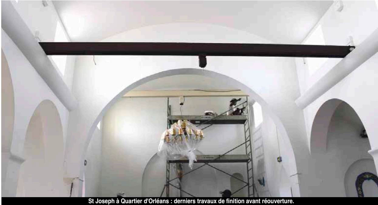
St Joseph à Quartier d'Orléans : derniers travaux de finition avant réouverture.

Saint-Martin se distingue par sa population multi ethnique et son multilinguisme. Il en va de même pour les religions. Une situation due aux populations qui ont peuplé l'île dans un premier temps (anglaise, hollandaise, française ...) puis dans un second temps aux nouveaux arrivants de toute la Caraïbe. La liberté de culte est de mise sur la Friendly Island qui compte près d'une trentaine de lieux officiels, de toutes confessions.