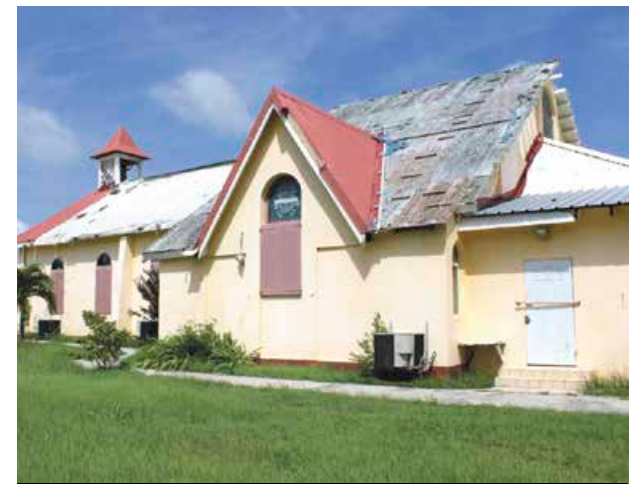
L'église de Grand Case toujours fermée faute de toiture.