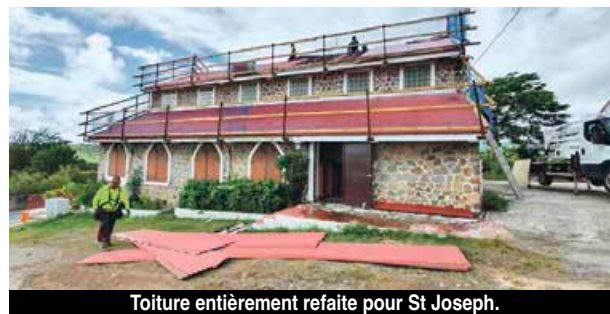
Toiture entièrement refaite pour St Joseph.

L'Église de Marigot et celle de Grand-Case sont propriétés de la Collectivité de Saint-Martin. Seule la Chapelle de Quartier d'Orléans appartient au diocèse de Guadeloupe. Mais à Marigot la salle paroissiale