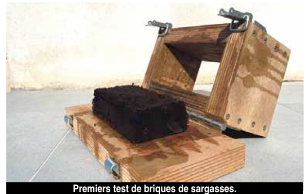
Premiers test de briques de sargasses.

Après la pâte à papier et à carton, les phases de test ont continué sur une pâte à sargasse cette fois solide. L'idée des briques est née de la demande d'un acteur industriel de la cellulose moulée. Le premier test démontre que la transformation est assez facile. Assez basiques pour le moment les petites briques pourront servir à la construction mais pas que ... car le procédé démontre que les sargasses, solidifiées, sont assez résistantes pour être moulées en toutes formes d'objets. A terme, tout ce que l'on connaît actuellement sous forme d'emballage plastique pourraient être remplacé par ces moules de sargasses.