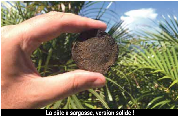
La pâte à sargasse, version solide !