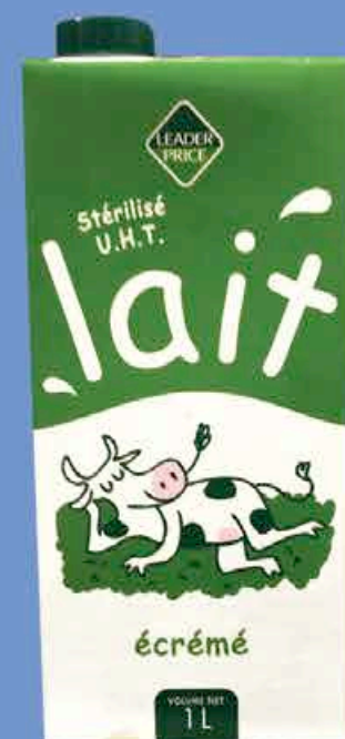
LAIT ÉCRÉMÉ LEADER PRICE 1L - LE LITRE : 0,80€