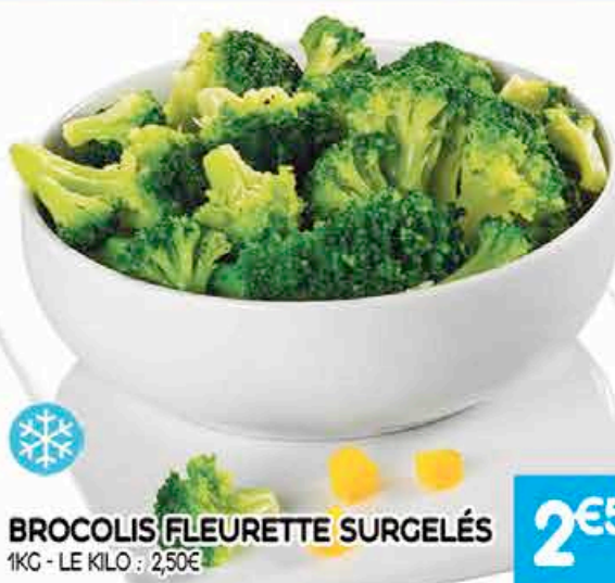
BROCOLIS FLEURETTE SURGELÉS 1KG - LE KILO : 2,50€