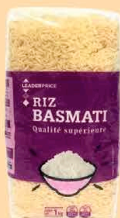
RIZ BASMATI LEADER PRICE 1KG - LE KILO : 2,35€