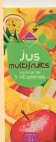
JUS MULTIFRUITES LEADER PRICE 2L - LE LITRE : 1,48€