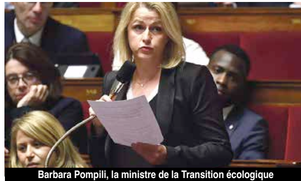
Barbara Pompili, la ministre de la Transition écologique

Un projet de loi serait en préparation dans les tiroirs du ministère de la Transition écologique visant à encadrer voire bannir du petit écran des campagnes promotionnelles réalisées par les offices de tourisme de certains territoires, dont la Guadeloupe et la Martinique. Les trajets pour s'y rendre seraient jugés nocifs pour l'environnement.