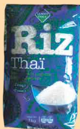
RIZ THAI RISO LEADER PRICE 1KG - LE KILO : 1,99€