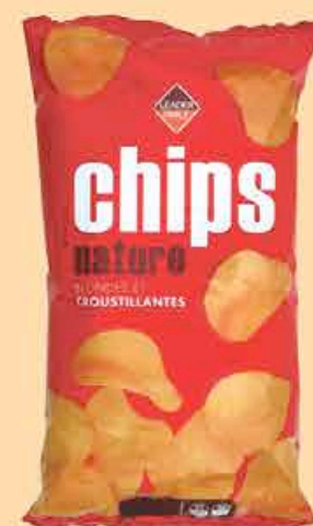
CHIPS NATURE LEADER PRICE 350G - LE KILO : 8,54€