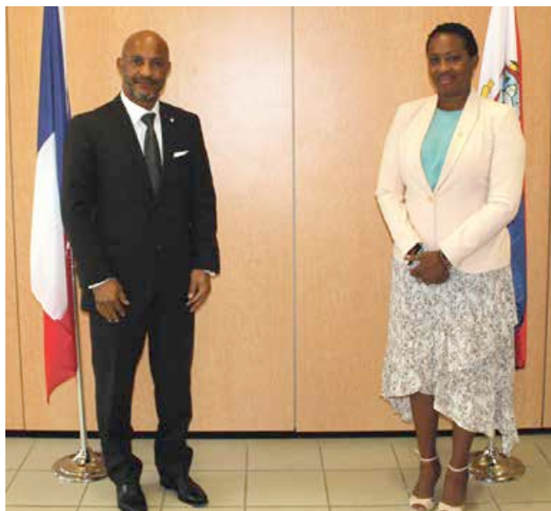
Le président Daniel Gibbs et la première ministre Silvéria Jacobs.

Jeudi 17 septembre, le Conseil des ministres de Sint Maarten et l'exécutif de la Collectivité de Saint-Martin se sont rencontrés dans le cadre d'une réunion de coopération organisée dans les locaux du Government Building à Philipsburg. Cette réunion avait été décidée d'un commun accord entre la Première Ministre de Sint Maarten Silvéria Jacobs et le Président Daniel Gibbs, dès dimanche 13 septembre, alors que les deux territoires faisaient face aux restrictions de circulation aux frontières et à l'annonce d'une marche de contestation.