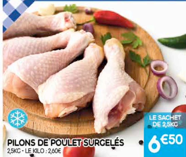
PILONS DE POULET SURGELÉS 2,5KG - LE KILO : 2,60€