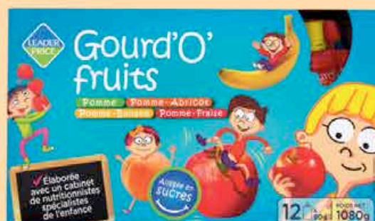
GOURD'O'FRUITS X12 PARFUMS ASSORTIS LEADER PRICE 1080G - LE KILO : 2,77€