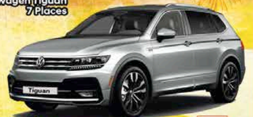
Volkswagen Tiguan 7 Places