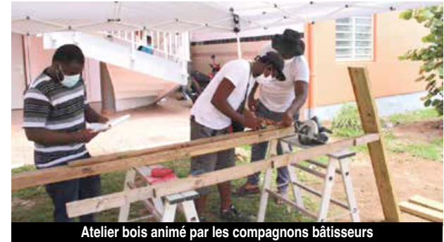
Atelier bois animé par les compagnons bâtisseurs

associations. L'atelier de quartier est donc un premier pas qui s'inscrit dans un projet plus global : l'amélioration de l'habitat et des infrastructures, notamment administratives, très attendues par la population de Quartier d'Orléans. Les nouvelles installations de la CAF et de Pôle Emploi sont en passe de se concrétiser et celle de La Poste est en cours de négoc-