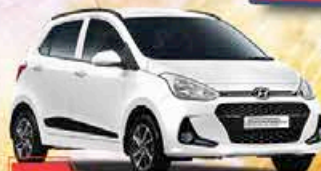
Hyundai Grand i10 Citadine/Berline