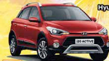
Hyundai i20 Active