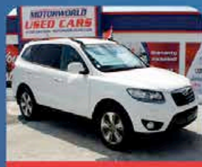
HYUNDAI SANTA FE